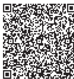
携帯電話登録用 2 次元バーコード

【市ホームページから】 市のホームページ ( http://www.city.daisen.akita.jp ) にアクセスし「いち早く」と「防災メール」を選択します。 ※「防災ネットだいせん」のページからは前記の②、③と同じ手順