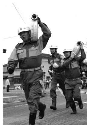
〔写真〕新しい活動服に身を包み訓練に励む消防団員

消防団は今年度から活動服を一新。紺色を基調に、腕や胸の部分にオレンジ色を配色したデザインとなりました。