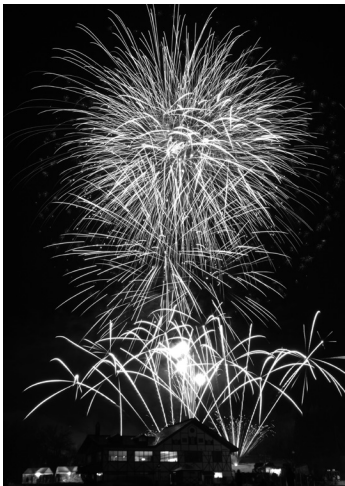
〔写真〕 約1,500発の花火が打ち上げられた新作花火コレクション

メインが打ち上げられるなど、会場に集まった約3万5千人の観客は早春の夜空に広がる約1,500発の花火を楽しみました。