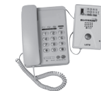
振り込め詐欺見張隊「新117」