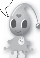
水道局マスコットキャラクター ぼたぼん