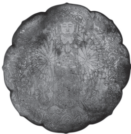
国宝「線刻千手観音等鏡像」（平安時代）