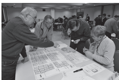
講座では講話のほか、災害時を想定した避難所運営などの演習を行います。

◆ 対象 ／自主防災組織のメンバーまたは今後、自主防災組織の設立を検討している自治会・町内会のメンバー