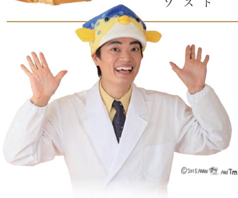
東京海洋大学名誉博士