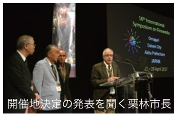
市長栗川 大曲の花火の開催地決定の発表を聞く

歴史や大会概要、日本の花火技術の素晴らしさなどを、映像を交えながらPRしました。次回開催地にはオーストラリアのシドニーやスペインのビルバオも立候補していました。が、会場の安全面や交通の利便性などで評価を受けた大仙市が選ばれました。シンポジウムが国内で開催されるのは、2005(平成17)年の滋賀県大津市以来2回目です。