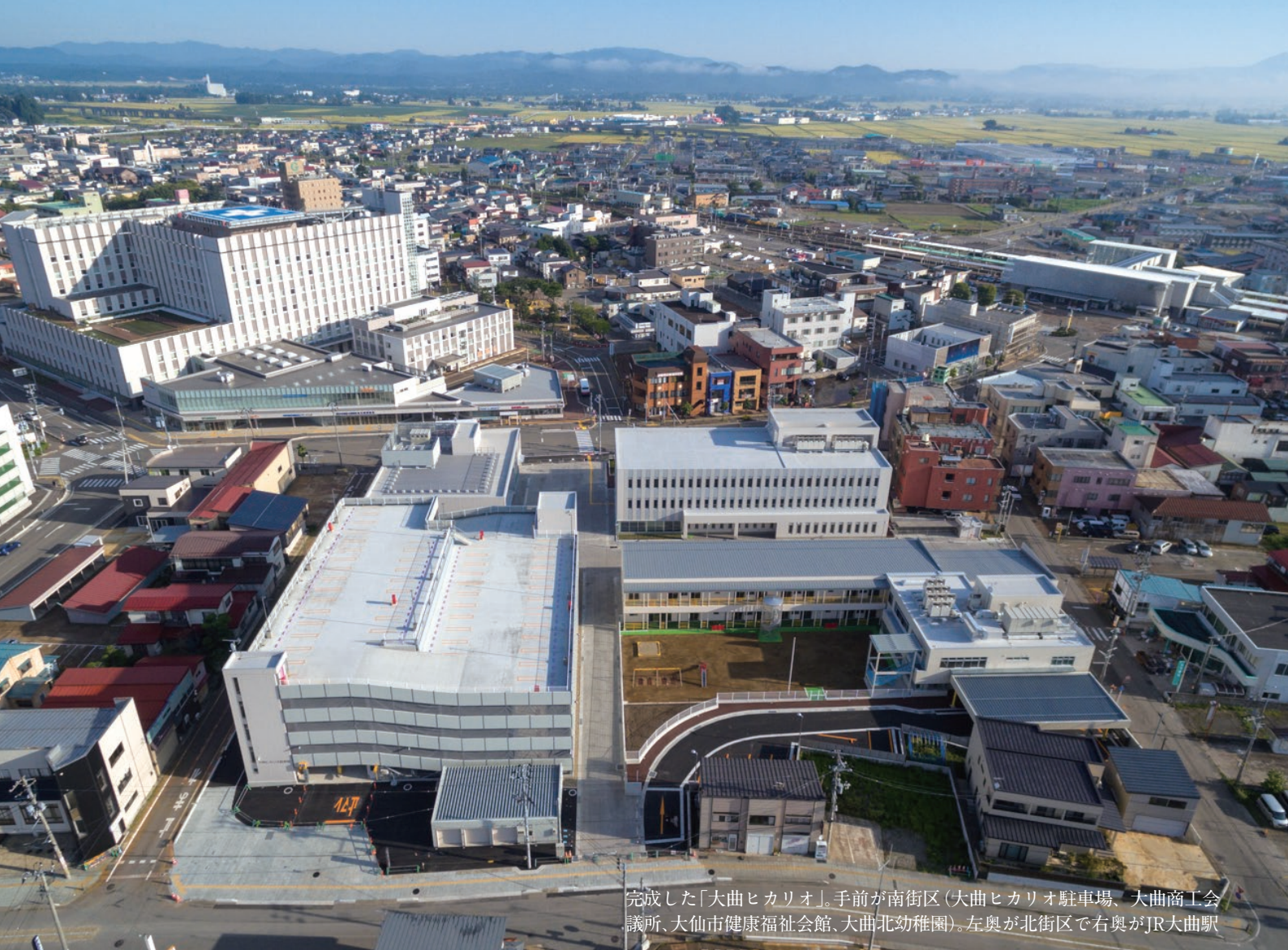
完成した「大曲ヒカリオ」。手前が南街区（大曲ヒカリオ駐車場、大曲商工会議所、大仙市健康福祉会館、大曲北幼稚園）。左奥が北街区で右奥がJR大曲駅