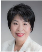
講師 上川陽子 衆議院議員