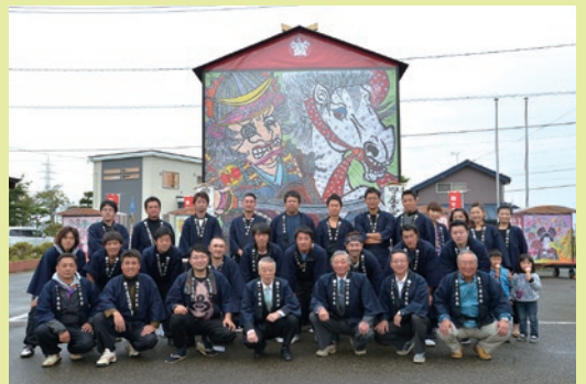
10月11日に行われた「四ツ屋まつり」を訪れ、まつりの運営に携わる地元の若者メンバーと記念撮影をする栗林市長(写真前列中央)

※弔慰=行政委員会の委員等、市政に深く関わりのある方や旧市町村の功労(績)者に対する香典など