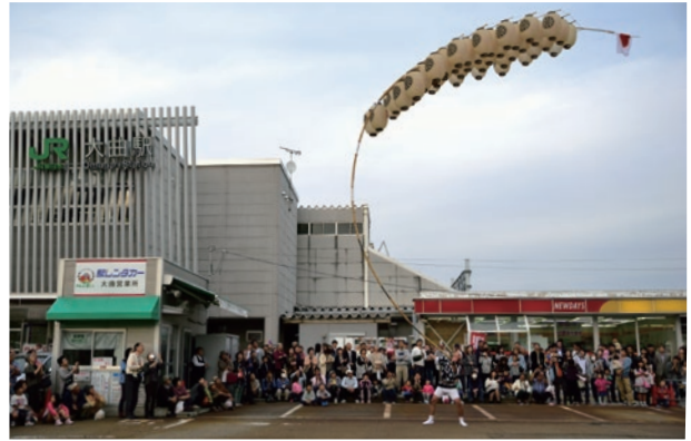
[写真]観客から歓声が上がったJR秋田支社竿燈会の妙技

現在は、息子夫婦と孫1人との4人暮らし。テレビでの相撲観戦が大好き。健康維持のため、家の中で歩行運動をしているそうです。