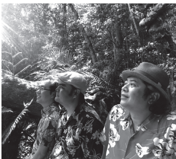
デビュー25周年を迎えたBEGIN