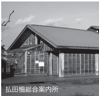
弘田柵総合案内所