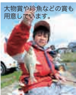
大物賞や珍魚などの賞も用意しています。