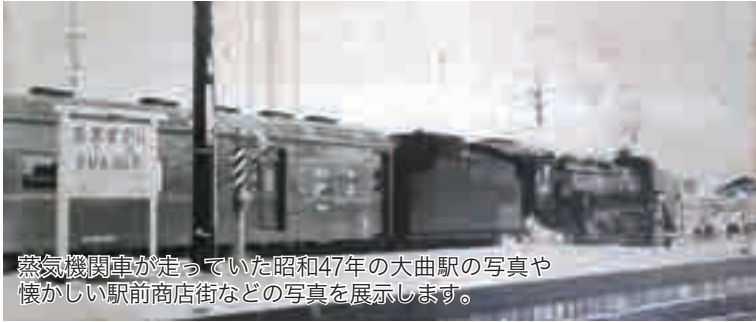
蒸気機関車が走っていた昭和47年の大曲駅の写真や懐かしい駅前商店街などの写真を展示します。