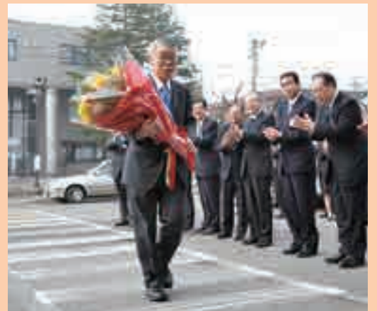
3月31日に告示された大崎市長選挙で無投票により再選。4月1日、市職員に拍手で迎えられながら再選後、初登庁する栗林市長

※慶祝=市長等が出席する行事の会費やお祝いなど ※協賛=各種事業協賛金や各種大会市長賞および副賞など ※弔慰=行政委員会の委員等、市政に深く関わりのある方や旧市町村の功労(績)者に対する香典など