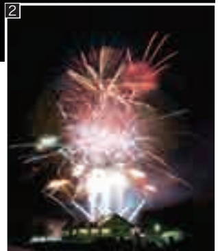
2 スーパーこまちの茜色・青色・黄金色を中心に、なまはげや竿燈を模した花火などで全国からの来場者に秋田の観光をアピールしたファイナル花火