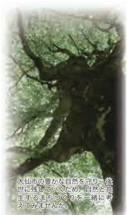
大仙市の豊かな自然を守り、後世に残していくため、自然と共生するまちづくりと一緒に考えてみませんか。

した「循環型社会形成推進キャラクター」と「Noレジ袋推進標語」の表彰や環境展なども行います。ぜひ、お越しください。