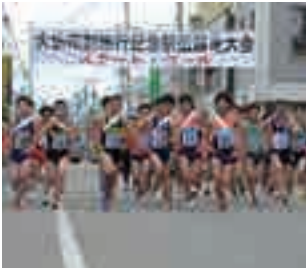
熱い戦いを繰り広げるランナーたちへの声援をお願いします。