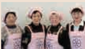
大仙市食生活改善推進協議会 仙北支部

い つも盛りだくさんの情報を見やすい紙面で届けてくださりありがとうございます。4月の広報見聞録に掲載されたいたメールサップ採取体験、とても興味深かったです。自分でメールサップを採取するワクワクする気持ちやメールサップの甘さおいしさが伝わる写真と記事でした。大仙市にはいろいろな場所、人がいるのだなとあらためて思いました。もっともっと大仙市を知りたくなりました。