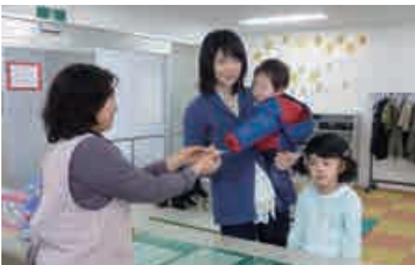
▲ 両施設とも登録・利用料無料です。気軽にご利用ください

同施設は、大曲駅前の土地区画整理事業で建設された大花都市再生住宅内に平成21年開設。子育てアドバイザーや高齢者生活援助員を配置し、親子や高齢者がくつろげるスペースとして親しまれています。子育て支援施設の延べ利用者数は4万1,265人、高齢者生活相談所の延べ利用者数は1万2,020人(登録者数332人)と多くの方々に利用されています(3月末現在)。