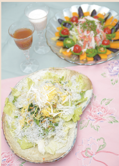
お好みのドレッシングをかけて旬の野菜を味わおう—