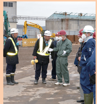
4月18日に岩手県遠野市、宮古市、大槌町などを視察。宮古市藤原埠頭の災害廃棄物破碎・選別エリアを視察し、現場作業員に進捗状況などを確認する栗林市長(写真中央右)

※ 慶祝 ＝市長等が出席する行事の会費やお祝いなど ※ 協賛 ＝各種事業協賛金や各種大会市長賞および副賞など ※ 弔慰 ＝行政委員会の委員等、市政に深く関わりのある方や旧市町村の功労(績)者に対する香典など