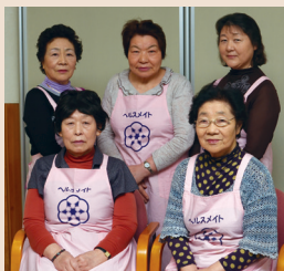
大仙市食生活改善推進協議会南外支部