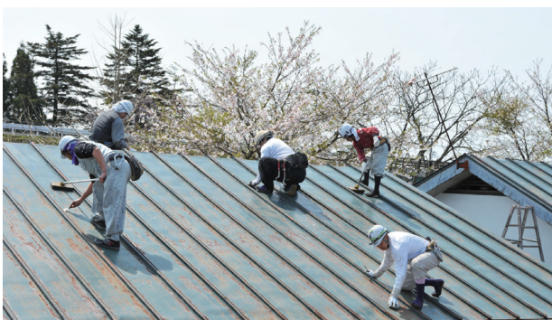
▲持ち前の技術で屋根の錆び落とし作業をする組合員

桜満開の晴れ渡る空の下、塗装された屋根や遊具は、熟練されたプロの技術により輝きを取り戻しました。