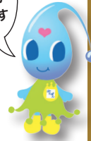
水道局マスコット キャラクター ぼたぼん