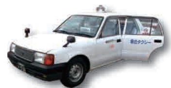
路線バス「中山線」の廃止により10月から運行される大曲の乗合タクシー「中山線」。運行は予約制です。なお、利用には事前の登録が必要です。

※沿線住民の方には、だいせん日和9月号と一緒に乗合タクシーについてのチラシと利用登録用紙を配布します。 利用者が少ないとはいえず、近くに公共交通の路線がない方や自家用車の移動が困難な方にとって必要な