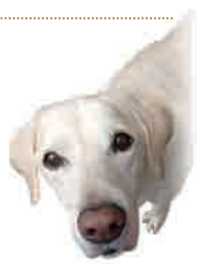
愛犬を守るため、必ず狂犬病予防注射をしましょう。

狂犬病は、予防注射を徹底することで犬での蔓延が予防され、人への感染も防ぐことができます。