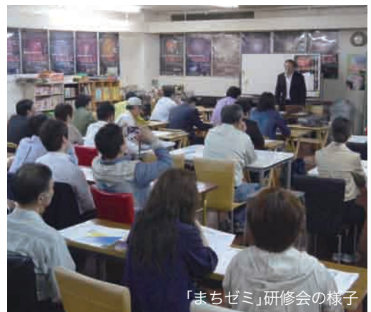
「まちゼミ」研修会の様子

「丸子川夕やけ音楽祭&七夕花火」や「土屋館わいわい広場」などのイベント開催を通じて大曲駅前周辺の活性化に取り組んできた花火通り商店街。商店と市民との結びつきを強くし、まちなかのにぎわい創出につなげようと新たに企画したのが「まちなかゼミナール」(通称「まちゼミ」)です。