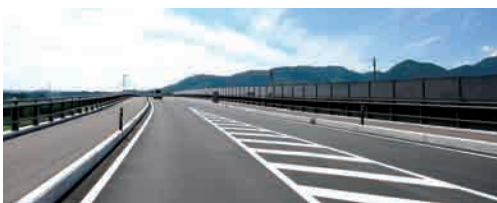
開通した大曲花火大橋。歩道を含め、幅が14メートルと大曲橋の倍以上になった。

大曲花火大橋を渡った方は「道路が広くなったおかげで、対向車を気にすることなく安全に通行できて安心した」と話してくれました。