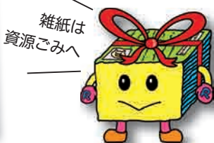
循環型社会形成推進キャラクター 「しげんくん」