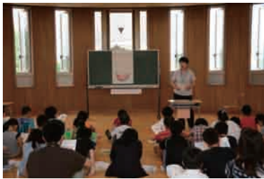
6月に花館小学校で行われた認知症サポーター養成講座の様子

講座を修了した認知症サポーターには認知症の方を支援する目印として、「オレンジリング」を進呈します。あなたも認知症サポーターとなつて、みんなが安心して暮らせるまちづくりに参加してみませんか。