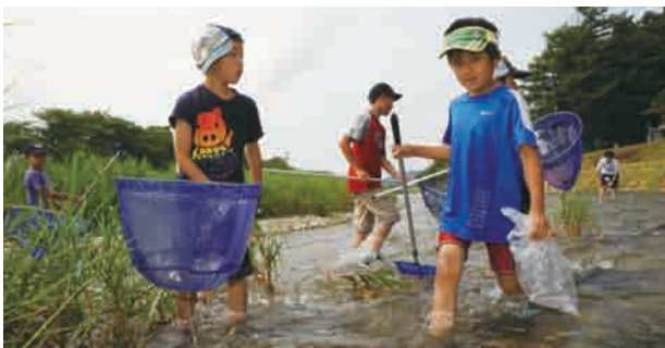
▲網を使って水生生物を採取する子どもたち(8月6日)

子どもたちに自然とのふれあいの機会を提供し、環境保護に興味をもってもらおうと、市が毎年実施している体験型学習（「昆虫博士になろう」は大仙市青少年健全育成会議と共催）。参加した子どもたちは、昆虫や魚の観察をしたり、説明員から動植物の生態系に関する説明を受けたりするなどの学習を通じて、自然を守り育てることの大切さを学びました。