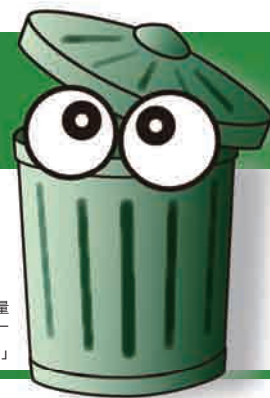
大仙市ごみ減量キャラクター 「ごみナビくん」