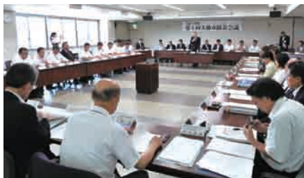
関係者が出席して行われた会議。委員からは「地域の実情にあった訓練も必要」「自分たちができる部分に委員自身も関心を持ちたい」「有事の際に情報が伝わりやすい体制を整えてほしい」などの意見が出されました。

また、①東日本大震災の教訓を踏まえた地震対策の抜本的強化②大規模広域的な災害時の被災者対応等の強化③風水災害等を踏まえた防災対策―を見直しの重点とし、「減災」（被害を最小限に食い止めること）の視点や県沿岸部などへの後方支援計画等を