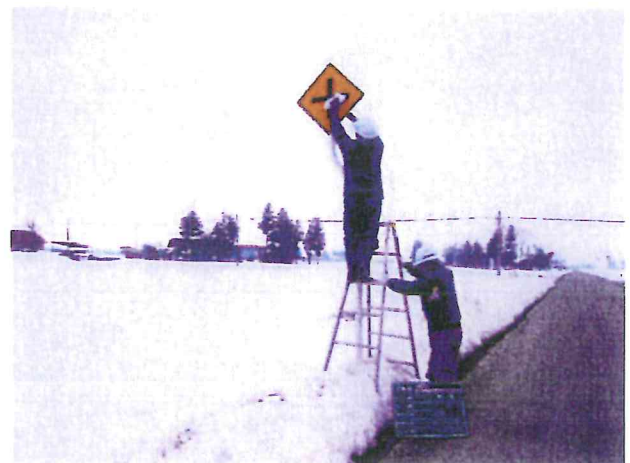
地域貢献活動 (標識清掃)