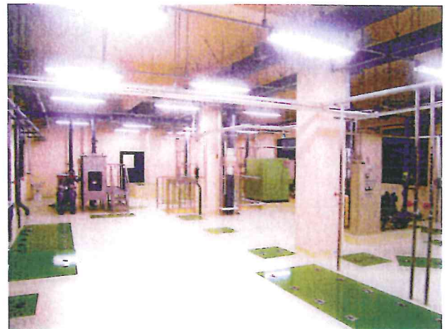
完成写真（完成内部）