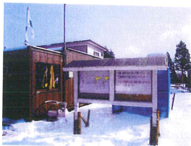
掲示板設置による周知活動