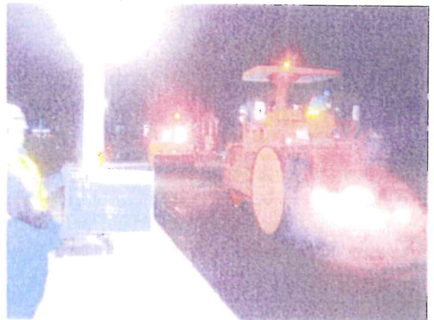
工期短縮のための夜間作業