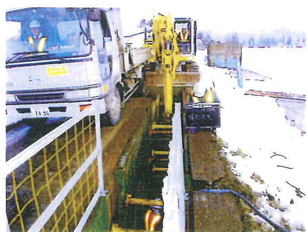
安全管理状況 (転落防止柵)