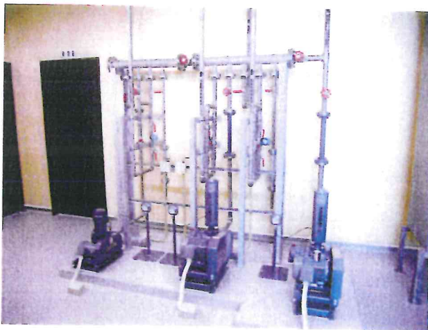
完成写真（ブローワ）

本工事は、処理施設内の工事であり、関連工事との施工調整など、綿密な工程管理が要求される工事であり、他工事との連携、対応策の検討、関係者との連絡調整において、円滑な進捗に努めた。また、地元住民のため、施設内説明用パネルを設置するなどの創意工夫がみられる他、出来形に優れた工事である。