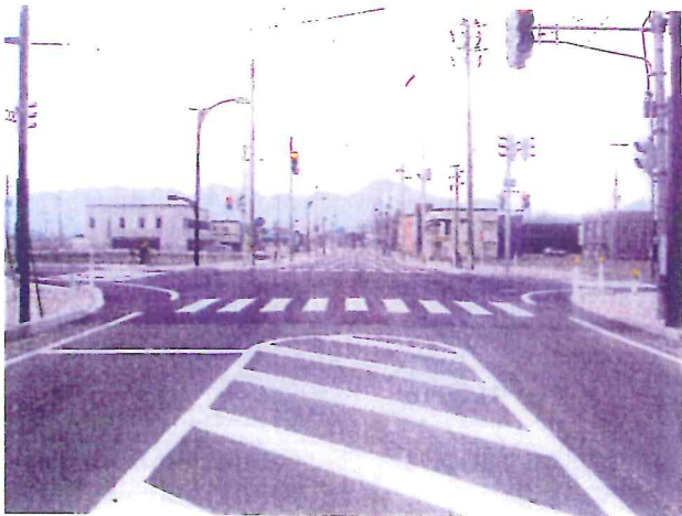
完成写真 (交差点部)

本工事は、大曲駅周辺の交通量の多い住宅地及び商業地であるため、安全対策が重要視される工事であった。関連工事の予期せぬ工程変更により限られた工期内での施工であったが、夜間工事等で工期短縮を図り、かつ、緊急車両や関係機関との調整、地元住民への施工内容の周知徹底に努め、円滑で出来映えの優れた工事である。