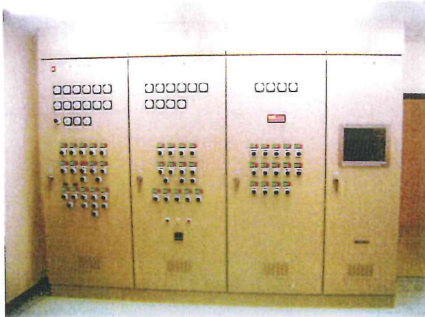
完成写真（制御盤類）

本工事は、処理施設内の工事で、関連工事との施工調整など、綿密な工程管理が重要視される工事であり、予期せぬ工程変更や対応策の検討に迅速に対応し、円滑な工事施工に努めた。また、豊富な経験と卓越した施工管理により、品質、出来形、出来映えにおいても優れた工事である。