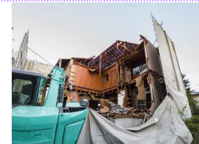
危険空き家の解体推進