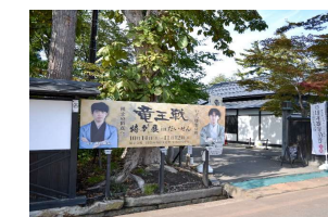
将棋竜王戦の会場 となった旧本郷家住宅

※JR東日本が実施する大型観光キャンペーンの重点販売地域に本県が選定されたことから、 観光キャンペーンに合わせ冬期間に不足する観光拠点として『旧本郷家住宅』をPRする (JR東日本観光キャンペーン期間：令和6年12月～令和7年2月末)