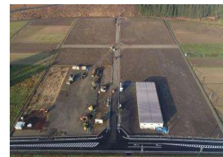
第2期企業団地造成工事