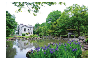
旧池田氏庭園等の文化財の 保存及び利活用の推進