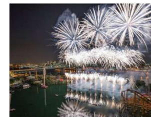
モンリオール国際花火競技大会

➢ 令和6年7月開催予定のモンリオール国際花火競技大会へ『大曲の花火』の出品 ※新たな財源確保への取組として、ガバメントクラウドファンディングを実施 ➢ 『市内小学生親子向け』観覧招待事業の拡充 (大曲の花火『秋の章』へ招待：100組→170組)