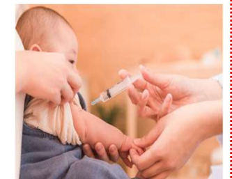
おたふくかぜ 予防接種経費の助成

【拡充】 市 おたふくかぜ予防接種経費の助成 2,000千円 (拡充額 760千円) ➢ おたふくかぜ予防接種回数を拡大 (1回 → 2回)