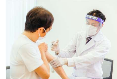
带状疱疹ワクチン接種費用を助成