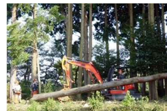
主伐から植林に係る一貫作業