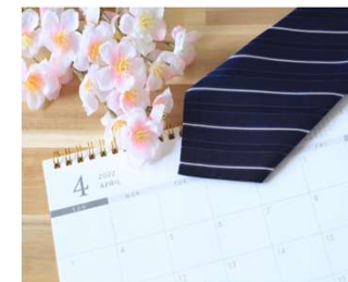
大仙市入社準備助成金