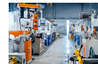
企業の設備投資へ支援