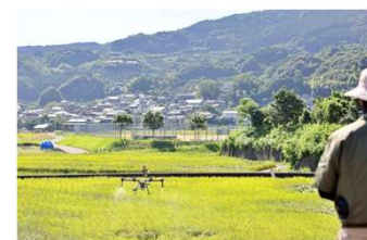
ドローン操作資格取得補助