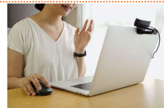
オンライン相談会の実施