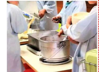
学校給食食材の高騰に対する支援

新規 国 市 法人立保育所への支援 179,738千円 ➢ 『おおたわんぱくランド』未満児棟改修工事に対する補助 (総事業費 202,387千円) ※令和5年度は補正対応