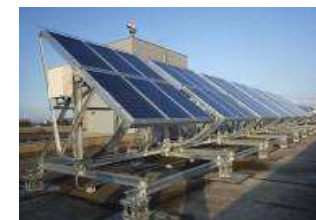
南小学区コミュニティセンター 太陽光発電設備