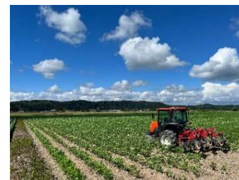
GPS衛星等を活用した自動運転装置付きトラクター