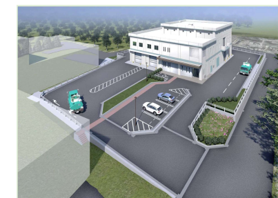
広域中央し尿処理センター