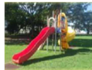
中仙 ドンパン広場