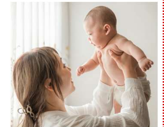
在宅保育すこやか応援事業

【拡充】 国 県 市 児童手当の拡充 910,675千円 (拡充額 99,535千円) ➢ 支給対象の拡充、所得制限の撤廃、手当月額の増額 ・支給対象： 高校生年代まで (18歳到達後の最初の年度末まで) ・手当月額： 高校生 1万円、第3子以降1万5千円 → 3万円