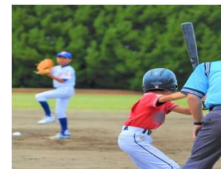
令和7年度大仙市で 世界少年野球大会の開催