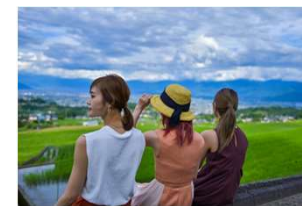
女性の視点を取り入れた 魅力体験ツアー

➢ 補助対象に空き家を取得し、住宅リフォーム工事を実施した移住者を追加 ・補助率：対象工事費の30% ・補助上限額：500千円