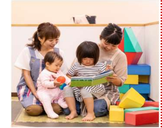
0～1歳児の保育料無償化

新規 市 0～1歳児の保育料無償化 40,735千円 ➢ 令和6年4月から全年齢層の保育料を無償化 (※0～2歳児の無償化による歳入減を含めた影響額 66,468千円)