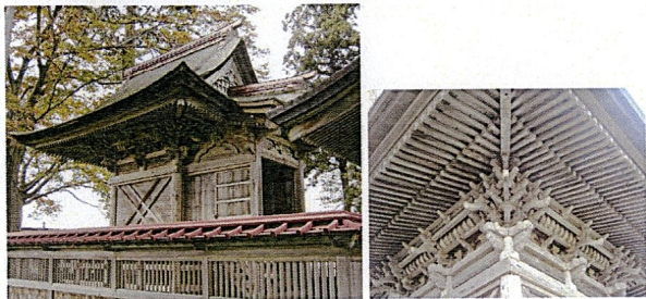
こしおうじんじゃ ほんでん