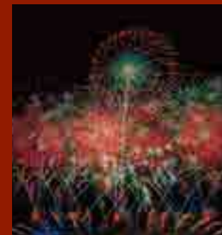
大曲の花火—秋の章— 「劇場型花火」 開催日：毎年10月第1土曜日