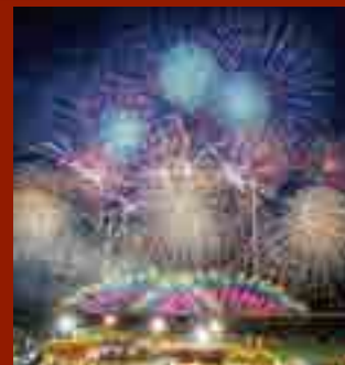
大曲の花火—春の章— 「世界の花火 日本の花火」 開催日：毎年4月下旬予定