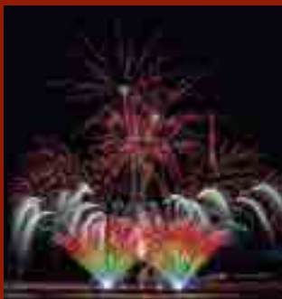
大曲の花火 「新作花火コレクション」 開催日：毎年4月下旬予定