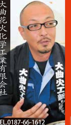
大曲花火化学工業有限公司