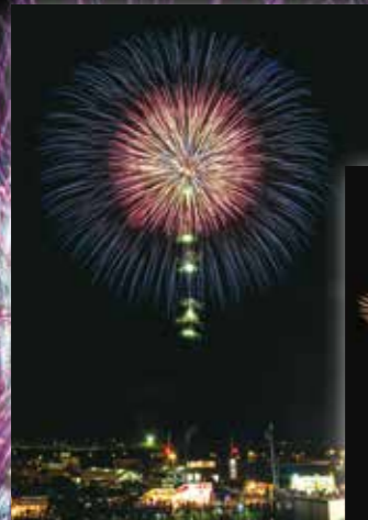
1尺大煙火球-菊花與牡丹類型