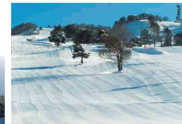
最後一頁/A-2 協和滑雪場