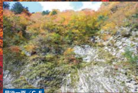
最後一頁/C-5 袖川立岩

樹幹有12.4米寬而被稱為本縣最大的大杉樹、樹齡有千年以上、它亦是全日本最大100樹的其中之一。