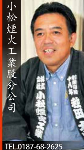
小松煙火工業股份公司