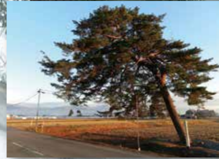
最後一頁/C-4 四橋的松樹

位於太田國見境的田園裏唯一的的松樹。在它的身旁沒有任何其他樹或高的建築物、所以它的存在感顯得更尖。