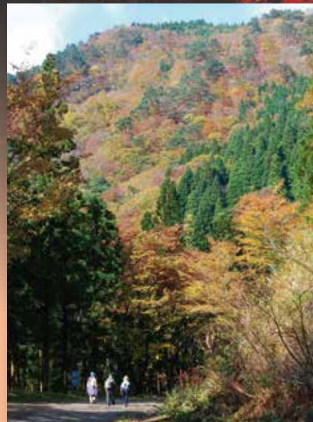
最後一頁/D-5 川口峽谷的遊步道

這個位於路旁的瀑布是由數個瀑布合流已成、於較遠的齊內河流下。瀑布壁上所生的青苔給觀賞它的人清涼的感覺。