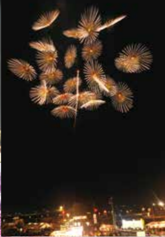
1尺大煙火球-自由類型