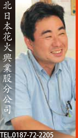
北日本花火興業股分公司