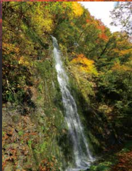
最後一頁/D-5 真木、川口峽谷