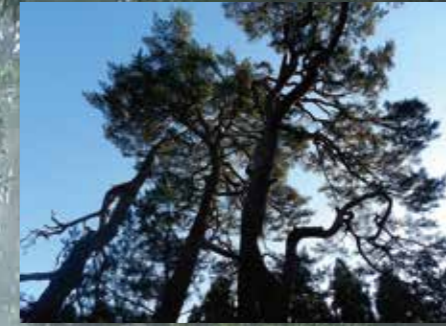
最後一頁/C-5 金冢的松樹

位於太田國見境的田園裏唯一的的松樹。在它的身旁沒有任何其他樹或高的建築物、所以它的存在感顯得更尖。