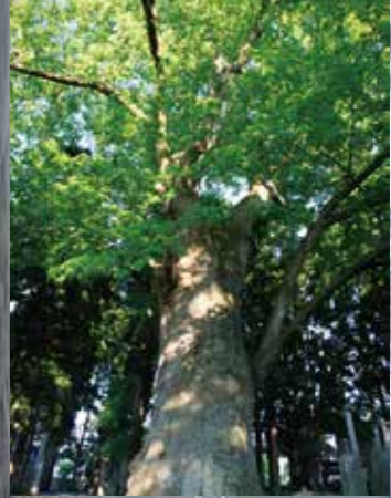
最後一頁/D-3 寶藏寺的大欖樹

神宮寺區內的寶藏寺有一顆大欖樹。它的樹齡大概有950年、而它的寬度和體勢更是本縣數一數二的。