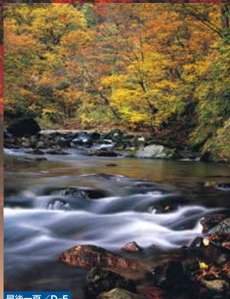
最後一頁/D-5 川口峽谷