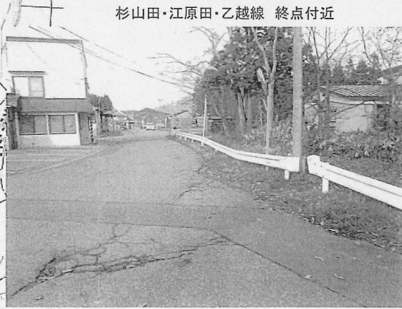
杉山田・江原田・乙越線 終点付近