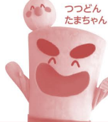
つつどん たまちゃん