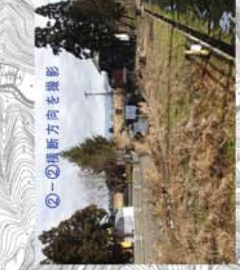
②-①② 第二明通方向を撮影