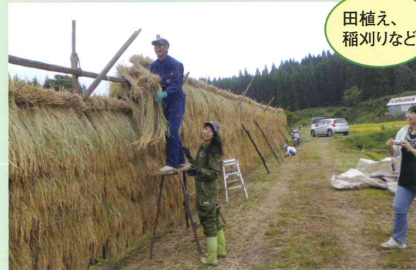
田植え、 稲刈りなど

〒019-2202 大仙市大沢郷宿椒沢130 TEL.0187-78-1994 FAX.0187-78-1994 http://www.hyakushomura-1.info