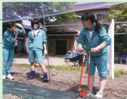
田植え、 稲刈りなど

〒014-1413 大仙市角間川町字前田12 TEL.0187-65-4086 FAX.0187-65-4086