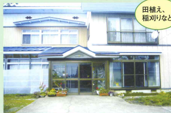
田植え、 稲刈りなど

〒014-0204 大仙市清水字中村145 TEL.0187-56-4249 FAX.0187-56-4249