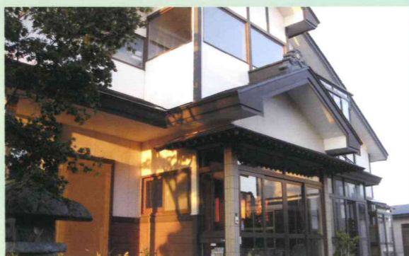
田植え、 稲刈りなど

〒014-0067 大仙市飯田字家ノ前97 TEL.0187-62-2840 FAX.0187-62-2840