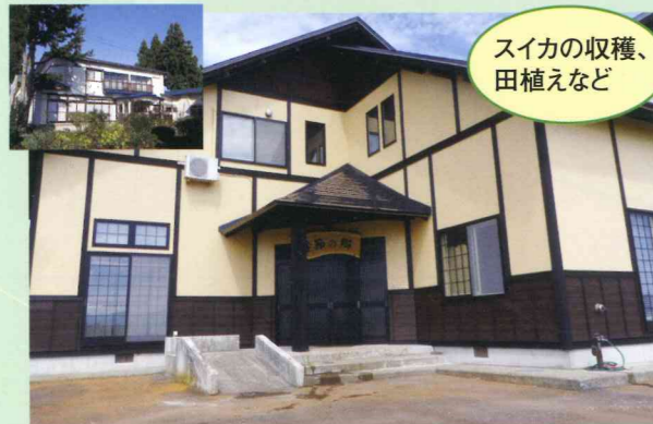
スイカの収穫、 田植えなど

〒014-1413 大仙市角間川町字旭森18-1 TEL.0187-86-5515 FAX.0187-65-3494 http://www.akita-gt.org/stay/minshuku/kisetsu.html