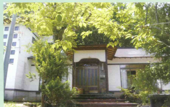
夏の夜の蛍の 乱舞は必見!

〒014-0073 大仙市内小友字石持51 TEL.0187-68-3099 FAX.0187-68-3099