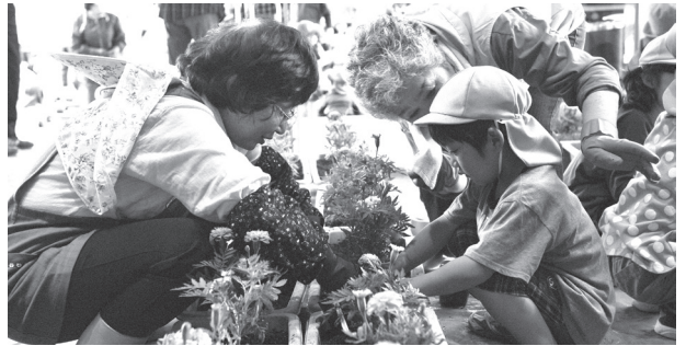
[写真]今年の「花いっぱい運動」には地元保育園児も参加