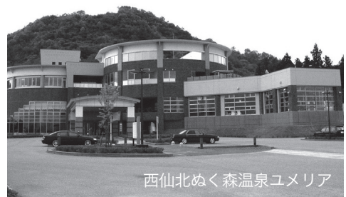
西仙北めぐ森温泉ユメリア