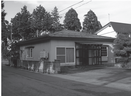
一般競争入札で売却する八乙女荘旧医師住宅(売却物件①)