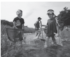
川に入って水生生物を捕まえその生態などを学びます。(写真は昨年環境学習)