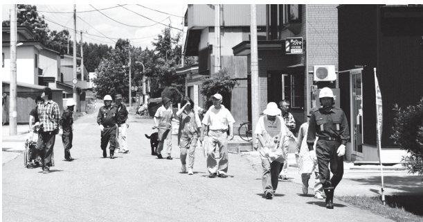
【写真】消防団員の誘導で避難場所まで移動する地域住民

このほか、消防団員による土のう積みやシート張り訓練、住民を対象とした防災学習会、AED講習会が行われ、地区全体で災害時の動きを確認しました。