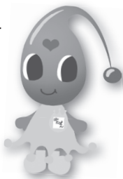
水道局マスコットキャラクター ぼたぼん