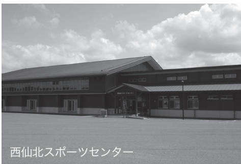
西仙北スポーツセンター