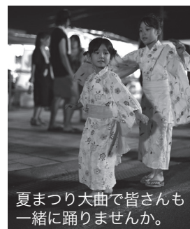
夏まつり大曲で皆さんも一緒に踊りませんか。