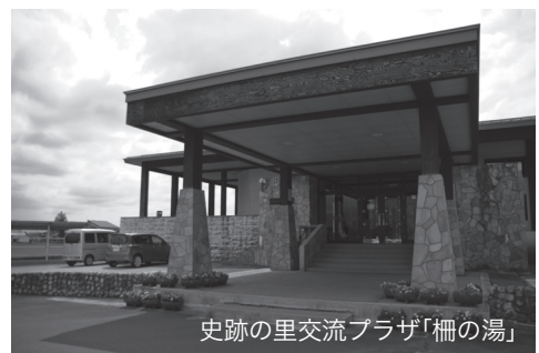
史跡の里交流プラザ「柵の湯」