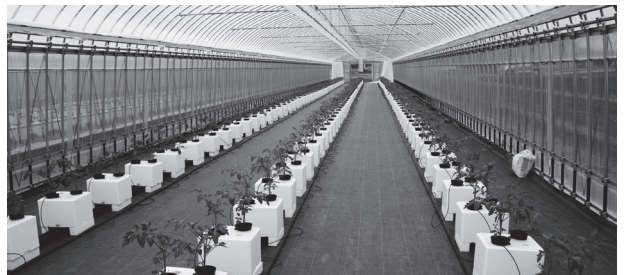
[写真]トマトが植えられた土入りの容器が並ぶ試験ほ場

同団体は「笑い、まなび、体を動かして心を癒す」をスローガンに活動しています。花の苗植えは、花を育て慈しむ心を育み、心の通う明るい地域をつくろうと「花いっぱい運動」として毎年実施。今年は地元の保育園と合同で実施したものです。参加者は178個のプランターにベゴニアやマリーゴールドなどの苗を植えました。