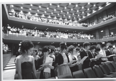
仲間と一緒に20歳の思い出をつくりま しょう。(写真は昨年の成人式)

してきます。自分たちの成人式の企画・運営に携わってみませんか。詳細は、生涯学習課に問い合わせください。