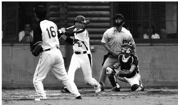
[写真]熟練選手がはつらつとしたプレーを披露