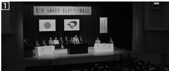
[写真] 1 およそ480人が参加した大会 2 心のあり方について講演した橋本さん

寄贈は、同団体が来年に控える設立40周年の記念と、5月に仙北地域で行われた秋田県ライオンズクラブの年次大会で同校の吹奏楽部から演奏してもらったお礼を兼ねたもの。同部の部員は「新しい楽器で頑張って練習に励みたい」と語りました。