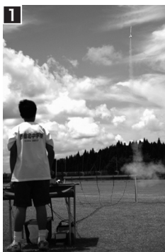
[写真] 1 発射ボタンを押すとロケットは大空へ 2 発射台にロケットを取り付けする中学生

【個人】信田健(西仙北)、藤澤政勝(中仙)、草薙美保子(中仙)、竹村正資(仙北)、須田重一(仙北)、佐々木信尾(太田) 【団体】大花町自主防災委員会(山信田齊委員長・大曲)、船岡地区交通安全会(渡邊恭悦会長・協和)