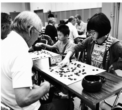
[写真]老若男女が腕前を競い合った市民交流囲碁大会