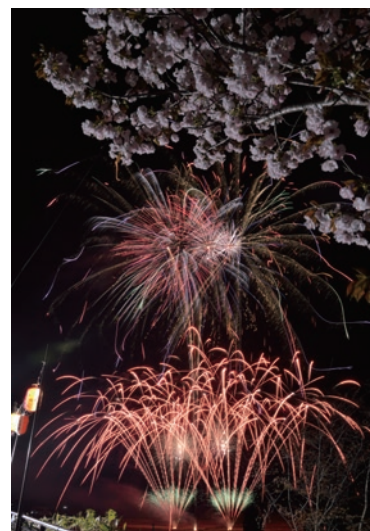
桜と一緒に花火を楽しむ余目さくら花火鑑賞会

今年は桜の開花が早く満開の桜と花火の共演とはなりませんでした。春の夜空を約1,000発の花火が彩り、来場者の目を楽しませました。