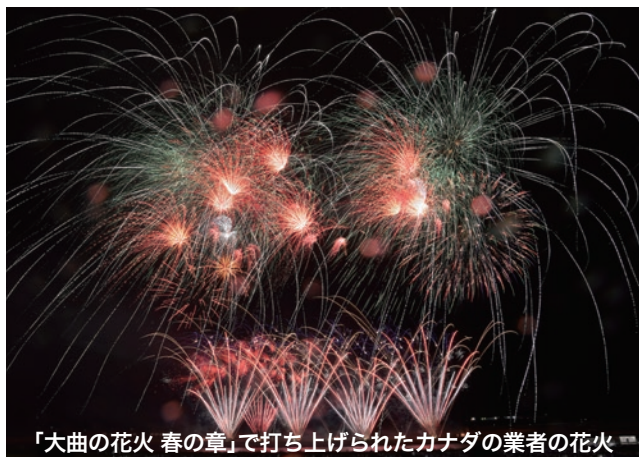
「大曲の花火 春の章」で打ち上げられたカナダの業者の花火

5人のパネリストは「土地に住む人々が外からの観光客を受け入れられるかが重要。その気運があるところには人が繰り返し訪れる」「観光客にまたここに来たいと思わせるものは人との出会い。自分の住む土地のことを自分の言葉で語ることができている人がいることが、地方都市が魅力的な観光地となるポイント」などといった意見を述べ、住民と観光客との関わり方が観光を軸にしたまちづくりを成功させるための鍵のひとつとして挙げました。