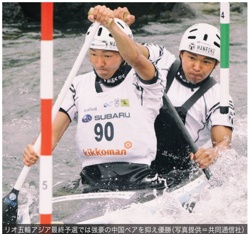
リオ五輪アジア最終予選では強豪の中国ペアを抑え優勝