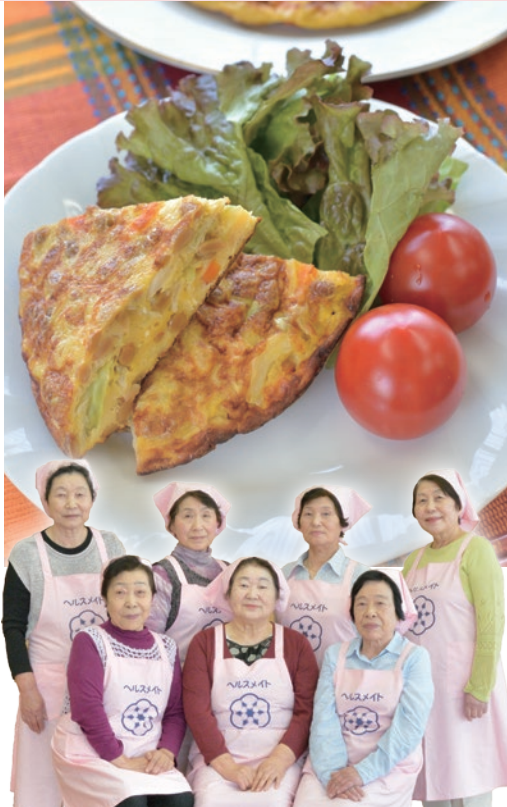
今月のレシピ当番は太田支部の皆さんです