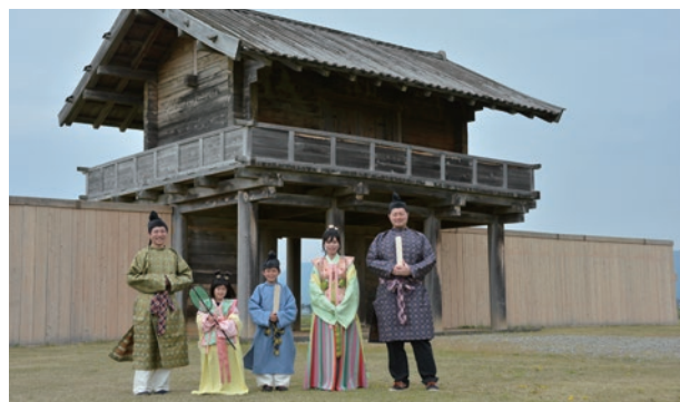
衣装を身に付け平安時代にタイムスリップしてみませんか

訪れる方に、見るだけでなくより楽しく史跡散策をしてもらおうと市が同案内所に設置したもの。衣装は男性用の2着、女性用1着、男の子・女の子用が各1着の合計5着。衣装のほか、頭巾や笄なども用意し無料で貸し出しています。洋服の上から簡単に着られ、着用したまま史跡内を散策することもできます。家族や友人と一緒に記念写真はいかがですか。詳細は弘田柵総合案内所(☎0187-69-2397)に問い合わせください。