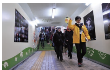
[上]モニターツアーで駅前を歩く国際教養大の留学生[中・下]「はなびちか路」の出入り口と地下道内部の様子