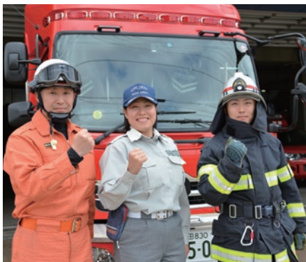
その使命感、市民のために。

大 曲仙北広域市町村圏組合消防職員(上級)採用試験の申し込みを開始します。 ※初級職採用試験の詳細は、だいせん日和8月号でお知らせします。 ◆ 受験資格 / 平成3年4月2日以降の生まれで大学を卒業した方、または29年3月31日までに卒業見込みの方 ◆ 申込書請求 / 消防本部総務課、大曲・角館の両消防署・各分署で申込書を交付しているほか、消防本部のホームページからダウンロードすることもできます。 ◆ 採用予定人数 / 4人程度 ◆ 申込期間 / 6月6日(月)から7月8日(金)までの午前9時〜午後4時30分(土・日を除く)