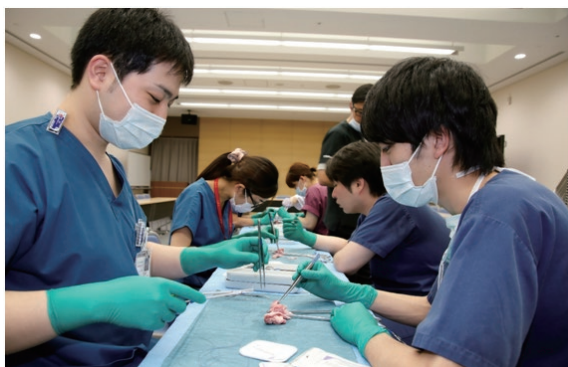
[写真]豚の臓器を用いた縫合実習に参加している研修医

3 月号では大曲厚生医療センターにおける「プライマリ・ケア」と、平成16年度から導入された「新医師臨床研修制度」についてお伝えしました。今回は、当院の「臨床研修」の状況を紹介いたします。 平 成28年度に秋田県内の病院で新たに研修を始めた新医師は84人に上り、過去最多となりました。そのうち7人の研修医が当院に加わり、2年目の研修医と合わせ計15人も初期研修医が在籍しています。内訳は、卒業大学別では秋田大学出身11人、東北大学出身が4人。性別では男性9人、女性が6人。出身地別では県内出身が7人、県外出身が8人です。