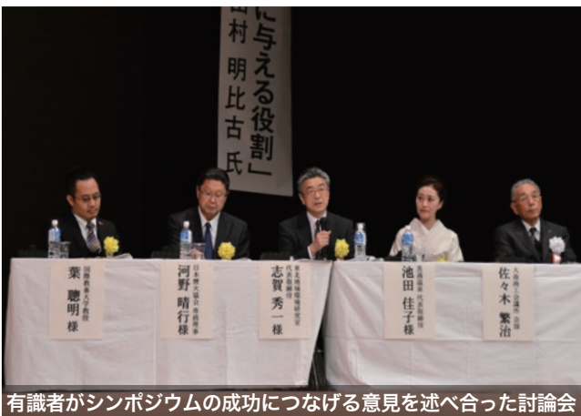
有識者がシンポジウムの成功につなげる意見を述べ合った討論会