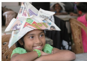
隊員が撮影した、世界の国の人々の「笑顔の写真」を多数展示。皆さんに元気をお届けします。

世界中で活動するJICA（国際協力機構）ボランティア隊員が、家族のように大切にしている現地の人々と撮影した「世界の笑顔」の写真を展示します。 ◆ 期間 ／6月4日（土）から19日（日）まで ◆ 時間 ／午前9時～午後7時 ◆ 会場 ／市民活動交流拠点センター（Anbee大曲2階） ※入場無料 【問い合わせ】 男女共同参画推進室 ☎0187(88)8039