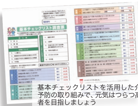
基本チェックリストを活用した介護予防の取り組みで、元気はつつつ高齢者を目指しましょう

市では、65歳以上の方で介護保険の要支援・要介護認定を受けていない方を対象に「介護予防のための基本チェ