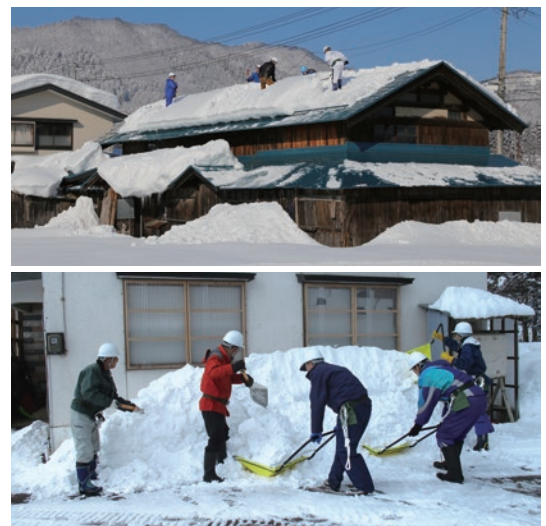
共助で雪対策に取り組む皆さんを応援します。