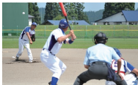
試合出場9人の合計年齢が550歳以上で行われる大会。年齢を感じさせないプレーの数々をご覧ください。