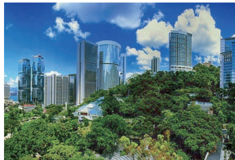
金融では世界第4位の国際競争力をもつ香港