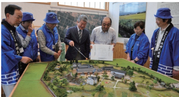
模型を見ながら説明を聞く池田家顕彰会会員の皆さん

庭園の全景を表した模型は、庭園の公開時に旧池田氏庭園案内所「巨洲館」内で見学することができます。