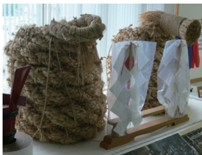
西仙北庁舎に展示しているミニ大綱