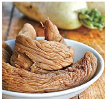
香港の大根漬「菜脯」

5 月に香港に行ってきた。私の両親は香港人。今回の訪問は10年ぶりでした。香港は、世界第4位の国際競争力をもつ金融の中心地（第1位はロンドン、2位はニューヨーク、3位はシンガポール）です。 国際交流員として来日する前、赴任先として初めて「大仙市」という地名を聞いたときに頭に浮かんだのは、香港にある「黄大仙」という道教のお寺の名前でした。「大仙」は広東語で「仙人」を意味します。「大仙市は『仙人の恵みを受けているまち』という意味だろう」と勘違いしていました。 香港と大仙市 四つの共通点 さて、今回の旅で、香港と大仙市のさまざまな共通点を見つけました。 第1の共通点は、漬け物の味付けです。大仙市に来て間もない頃は、しょっぱい「いぶりがっこ」の味にカルチャーショックを受けました。私がそれまで食べた日本の大根漬は酸っぱかったからです。今回の旅では、香港の大根漬もしょっぱいことが分かりました。香港の大根漬は「菜脯」と言い、細かく刻んで溶き