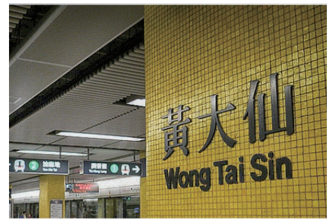
大仙市を思い出させる香港の「黄大仙」

卵と混ぜてオムレットにするか、おかゆやご飯と一緒に食べる習慣があります。 第2に、緑が多いことです。大仙市は田んぼに囲まれ、自然が豊かですが、香港では、政府が市民の生活環境の向上のため積極的に植樹していて、街の隅々まで緑であふれるようにしています。 第3は、方言の多様さです。秋田弁は「日本人でさえ理解できない」と言う人もいます。1年半以上秋田に生活している私もいまだに秋田弁を完全には聞き取れません。香港では広東語が公用語として使われています。広東語は「中国大陸の標準語」である北京語とは別言語といわれるほど違います。北京語を話せる香港人はめったにいないほどです。大仙市に住んでいる、特に若い皆さんが標準語と方言を時と場所に合わせて使い分けている様子を見ると、すごいなあ、と思います。 第4は、パンがおいしいことです。私が人生で一番おいしいと思ったパンは、大仙市で食べた、ケータリングカー（移動販売車）のメロンパンでした。香港にもメロンパンと似たパン