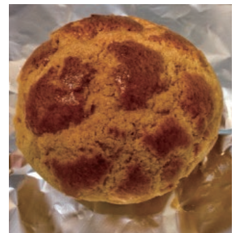
香港で食べた「菠蘿包」

があります。香港人の目には、パイんに似て見えることから「菠蘿包（パイナップルパン）」と呼ばれています。違いは菠蘿包の方がバター風味が強いことです。 日本の米も人気ですが… 香港では日本に好意をもっている人たちが多く、特に日本のキャラクターや食品が大人気です。香港出身者は日本を訪れる外国人の数でも例年上位に入っています。 日本の米もとても人気です。あきたこまち（秋田小町）と書かれている）も売られています。残念なことに新潟のコシヒカリや他の外国産米の方が人気があるように感じました。秋田に住んで大好きになったあきたこまち。そのおいしさをもちとつと海外の皆さんにも知ってほしいです。