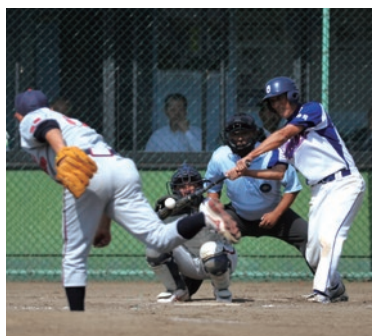
昨年の全県500歳大会で第3大健闘した大曲クラブと神岡大浦クラブが対戦した。写真左は大曲クラブの選手が本塁打を打つ瞬間。

日(月・祝日)まで ※開会式は、7月16日(土)午前8時から大曲球場で行います。 ◆試合開始／午前9時 ◆会場／大曲球場、神岡野球場、仙北球場 ※敗戦チームは、2日目に交流戦(神岡野球場、仙北球場)を行います。