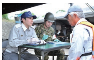
自衛隊と消防の協働による被災者の健康診断

に放置された自動車を撤去し、通行スペースを確保する訓練や、同校体育館内で避難所を開設・運営する訓練を実施しました。また、大曲総合公園で行われた第3部では、東日本大震災を教訓に、大地震で津波被害を受けた県沿岸部の被災地を後方支援する訓練を初めて実施。避難者役の由利本荘市にかほ市の住民約40人の受け入れや、自衛隊の輸送ヘリから大曲西中学校の生徒が救援物資を受け取る訓練などが行われました。 今回の訓練直前には熊本県でM7を超える内陸直下型の大地震が発生しました。市では、地域防災力の向上に取り組みながら、市民と行政が一体となった災害に強いまちづくりを進めていきます。