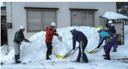
共助で取り組む必要性が高まっている今後の雪対策。市民と行政が一緒になって考えてみましょう。