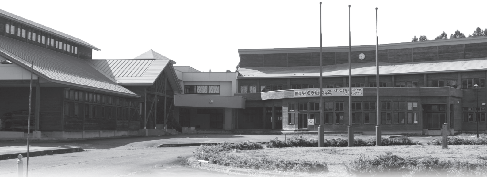
大仙市アーカイブズに改修予定の旧双葉小学校

市民の営みを後世に伝える行政文書や古文書。それらを収集し、市民共通の財産として広く公開し市民の皆さんに利用してもらおう施設がアーカイブズ（公文書館）です。アーカイブズが社会に与える影響、そして大仙市アーカイブズはどうあるべきか考えてみませんか。