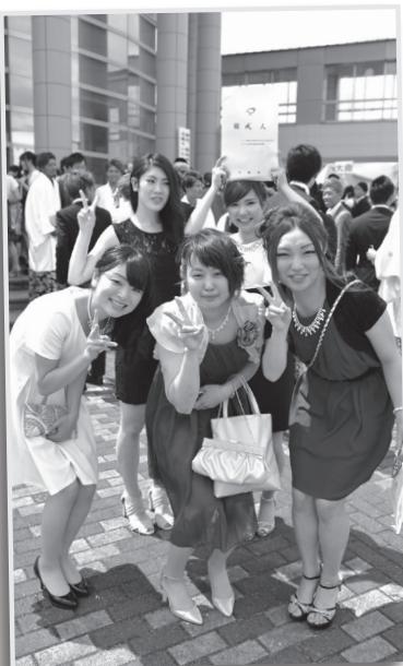
仲間と一緒に20歳の思い出をつくりましょう。