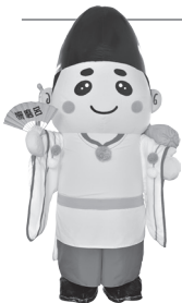
仙北地域マスコットキャラクター 柵磨呂くん