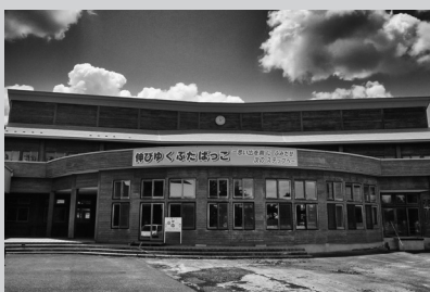
大仙市アーカイブズとして生まれ変わる旧双葉小学校

懇話会は平成26年8月から年4回のペースで開催されています。委員の皆さんからは施設の利用や運用に関する例規の検討など、多方面にわたって意見や助言をいただいています。第6回までの会議録は、市ホームページ（ http://www.city.daisen.akita ）で公開しています。