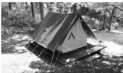
貸し出しのテントやバーベキューセットでキャンプをお楽しみください