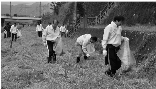
小さなごみも見逃さず丁寧に拾っていく参加者

同クリーンアップは、川のあるふるさとの景色を次の世代にも大切に引き継いでいこうと、毎年河川愛護月間の7月に行われているもので、太田地域でも行われています。各会場には、市民のほか市内企業や町内会、各団体などから約500人が参加。ごみ拾いや除草、花壇の清掃などを1時間かけて行われ、各会場合わせて550kgのごみが回収されました。