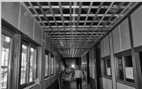
【写真上】改修工事が進む旧双葉小学校(西仙北) 【写真下】旧校舎2階廊下部分の様子

市では「大仙市アーカイブズ」の来年5月開館に向けて、着々と改修工事を進めています。8月から始まった工事は、屋根と外壁の塗装と屋上の防水工事がほぼ完了しました。現在は既存の施設を書庫や閲覧室、展示室に模様替える内装改修を行っています。建物の外観は、旧双葉小学校当時の雰囲気を残した同校のスローガン「伸びゆくふたばっこ」の看板もそのまま残しています。