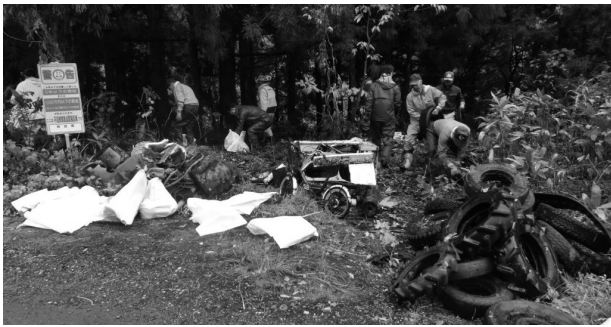
タイヤなどの廃棄物を撤去する参加者

廃棄物の不法投棄は、法律で禁止されています。地域の自然や景観を守るため、絶対にやめましょう。