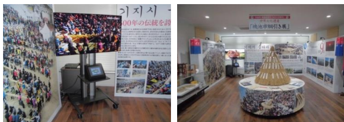
タッチ操作で映像が見られます