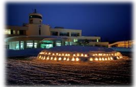
支所前につくられた「ミニかまくら」

午後6時には、花火が打ち上がり、ミニかまくらと花火の明かりが支所前を照らしました。