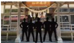
CMの絵コンテの一部

にしせん未来塾が大仙市からの依頼を受け、「第16回あきたふるさと手作りCM大賞」に応募するCMを制作することになりました。