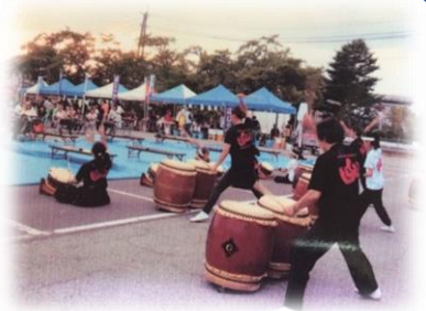
ステージイベントでは西仙北太鼓の会が力強い演奏を行いました

8月15日（水）午後5時に、西仙北支所正面駐車場を会場に、「にしせん納涼まつり」が開催されました。この事業は、ふるさと西仙まつりをより一層盛り上げようと新和会やほじの会が企画したもので、昼花火や地元企業による出店、地域の団体やジャズバンドが参加したステージイベントなどが行われました。