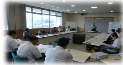
地域協議会の様子

8月3日（金）に、西仙北支所を会場に「第3回西仙北地域協議会」を開催しました。今回の協議会では、地域公共交通の再構築に関する意見書や、ひとづくり・ものづくり応援事業審査会についての報告、そして平成30年度の地域枠予算6件の審議を行いました。今回の協議会で承認された事業は次のとおりです。