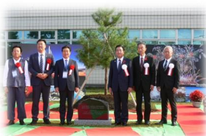
支所庁舎前では記念植樹、記念碑除幕式が行われました。唐津市の木であるアカマツを植樹しました。