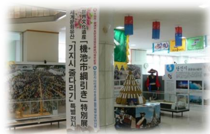
支所市民ホールではユネスコ無形文化遺産に登録されている「機池市綱引き特別展」が行われています。