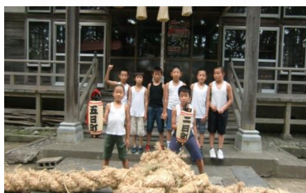
撮影に協力していただいた西仙北小学校児童

10月5日（金）午後3時より、にしせん未来塾が浮島神社、浮島会館で「第16回あきたふるさと手作りCM大賞」に出展するCMの撮影を行いました。撮影当日は、西仙北小学校4年生8名の児童と、4名の建元の方々にご協力をいただき撮影を行いました。