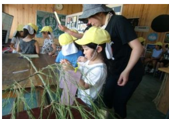
HUBスペースにたんざくを飾る西仙北あおぞら子ども園の園児

今年の4月から開放していましたが西仙北HUBスペースは、11月で一時閉鎖となります。このHUBスペースは西仙北中学校生徒が、地域にある空き家をリノベーションし、地域住民の憩いの場をつくりました。今年、にしせん未来塾のミーティングの場や、西仙北中学校や個人の方の作品展示等様々な用途に活用されてきました。