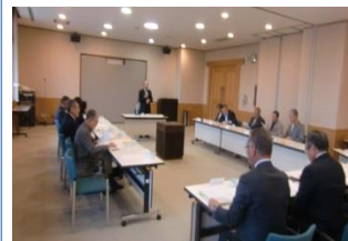
地域協議会の様子