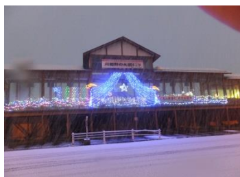
刈和野駅を彩るイルミネーション

12月18日（火）午後4時より、刈和野駅前にてイルミネーションの点灯式が行われました。