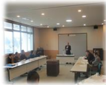
地域協議会の様子

その他の議案事項として、第5期地域協議会委員(令和2～4年度)選任に関する方針の説明がありました。