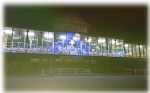
刈和野駅前を彩るイルミネーション