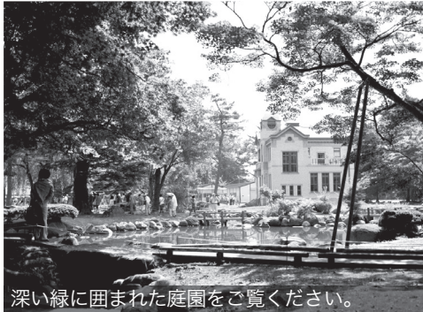
深い緑に囲まれた庭園をご覧ください。

旧池田氏庭園は、結婚記念撮影(前撮り)の場としても利用いただけます(カメラなどの機材および衣装は自己負担です)。撮影を希望する方は、気軽にお問い合わせください。