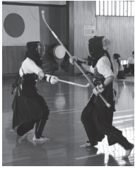
気迫あふれる なぎなた競技

詳しくは電話で問い合わせください。【問い合わせ】都市管理課 ☎0187-66-4908