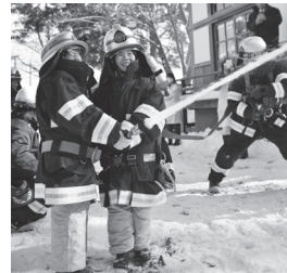
文化財防火デーに参加する東大曲小学校児童