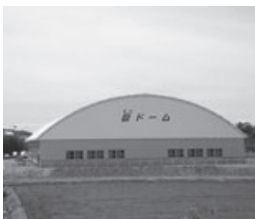
神岡中央公園内にある嶽ドーム