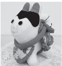
かわいらしい犬張子