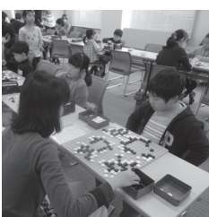
囲碁合宿に参加する児童