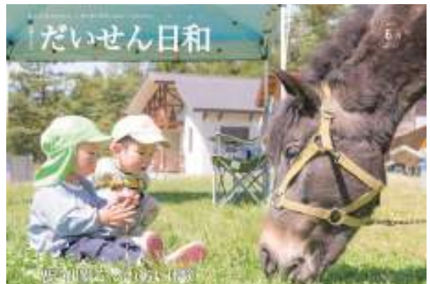
県代表として全国広報コンクールに出品される「だいせん日和」

選ばれたのは、2017年6月号の表紙写真。昨年5月に太田地域で開催された「黄桜まつり」で撮影したものです。草を食むポニーとそれを興味深げに見つめる子どもたちのあどけない表情や、ポニーと子どもたちの大きさの対比がユニークな一枚です。