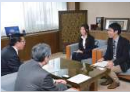
帰任後、老松市長に表敬訪問(2月8日)

とがあつて、海外に行かずその場に留まることももちろん正解だったかもしれませぬ。しかし、そこからどうしても飛び出して「発展途上国の現状」を自分の目で見ることにこだわりました。そして、その様子を目の当たりにして肌で感じてきたことは、かけがえのない財産になりました。今度は私が皆さんにもっといろいろな形でこの貴重な経験を最大限伝えていくことで、感謝の気持ちを表していきたい、と思っています。どこかでお会いできた際には「HOLA! (やあ!)」とお声がけください。2年間たくさん応援いただきました、本当にありがとうございます！