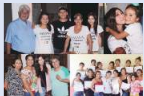
ボリビアでの送別会

また一方で、ボリビアでの「今を生きる。今が幸せならそれが一番」という生活も懐かしく、また恋しくなってきました。寝る時間になると、隣近所から毎日のように大きな音で聞こえてきたラテンの音楽。ボリビアに赴任した当初は「南米はすごいな」と圧倒されていましたが、いつのころからか、その音楽が子守歌のように感じはじめ、音楽がないと眠れないこともありました(笑)。「住めば都」という言葉は本当で、気づいたらボリビアにすっかりなじんで、好きになっていました。地球の反対側に第二の故郷ができたこと、そこに待っていてくれる家族や友人がいること。ボリビアで体験したさまざまな出来事はテレビの中の世界ではなくて自分の身に現実が起こったことだと今でも信じがたい気がします。そこでたくさんさんの経験を得たことは誇りでもあります。帰国した今でもホームステイ先の家族、看護学校の同僚や生徒、友