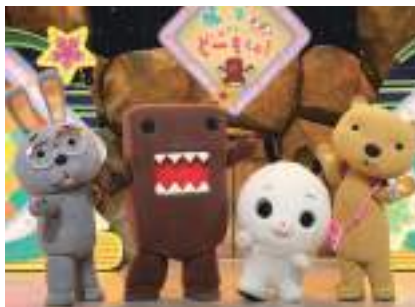
いつも元気などーもくんと楽しい仲間たち

NHK 秋田放送局 (土・日、祝日を除く) ☎ 018-825-8111 大曲市民会館 (月曜休館) ☎ 0187-63-8766