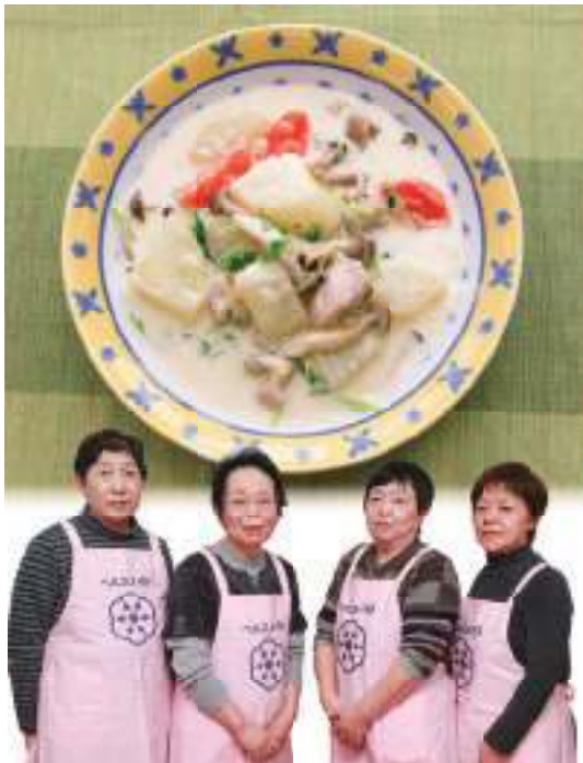
今月のレシピ当番は西仙北です