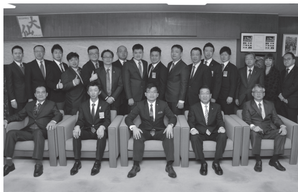
老松市長(前列右から2人目)を表敬訪問した中和JC