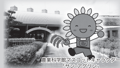
農業科学館マスコットキャラクター 「サン・アグリ」

農業科学館では、農業について楽しく学べる展示を行っています。皆さんのお越しをお待ちしています。