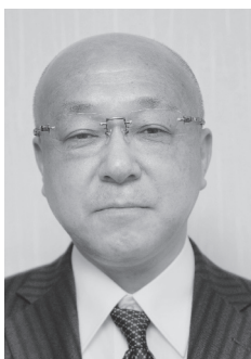
副市長 西山 光博

2月23日に招集された平成30年第1回議会定例会で、老松市長は副市長人事案件を提出し、財務省職員西山光博氏（59歳）が選任されました。西山副市長は北海道江差町出身で、1959（昭和34）年生まれ。1977（昭和52）年に札幌国税局に採用。1983（昭和58）年に大蔵省主計局、2002（平成14）年に財務省大臣官房総合政策課