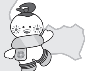
大仙市マスコット キャラクター 「まるびちゃん」