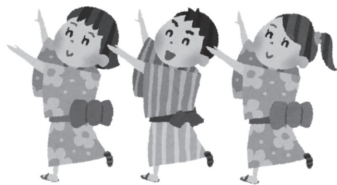
踊りを覚えて「おどりの広場」に参加してみませんか