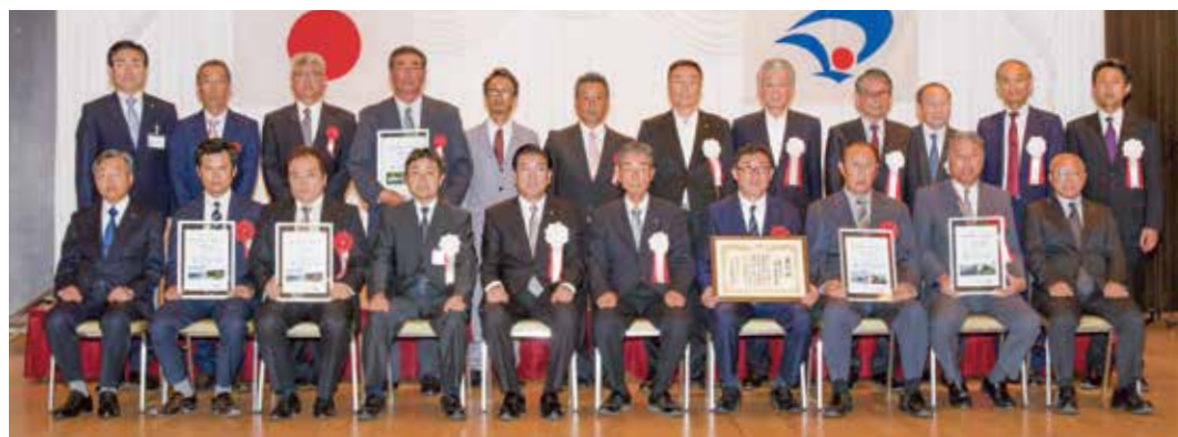
模範となる良好な工事を行った関係者を表彰する「優良建設工事表彰」

市が発注した建設工事で優良な工事を行った施工業者などを表彰する「大仙市優良建設工事表彰」の表彰式が6月26日、グランドパレス川端で行われました。