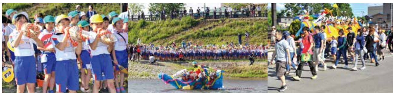
[写真]大曲小学校がふるさと教育の一環として実施している「鹿島流し」。地域の伝統文化が子どもたちに受け継がれています。

実行委員会は、子どもたちだけではなく、親世代・祖父母世代にも馴染みのある鹿島流しを継承していくことで、地域住民の連帯感を高めるとともに、伝統文化を生かして地域のさらなる活性化につなげていきたいとしています。