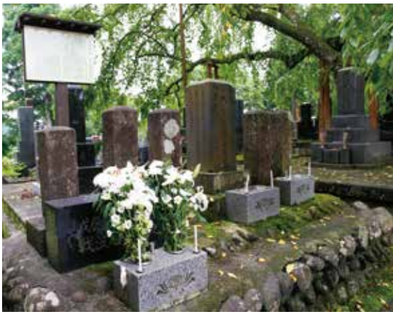
佐土原藩士を供養する慰霊碑(萬松寺)

戦禍から124年後の平成4年、亡くなった佐土原藩士が萬松寺で供養されていることを知った遺族をはじめとする墓参団が、旧協和町を訪問したことから、旧協和町と旧佐土原町の交流が始まりました。平成13年には有縁交流提携を結び、その交流は、両町が市町村合併を経た後も宮崎市と大仙市に引き継がれています。