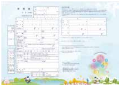
↑大仙市オリジナル婚姻届