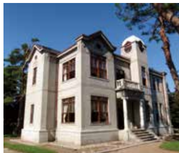
国指定重要文化財「旧池田家住宅洋館」