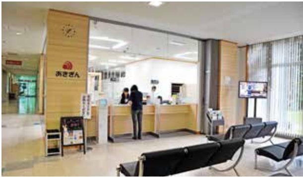
西仙北庁舎1階に移転した秋田銀行刈和野支店

同庁舎への同支店の移転は、行政サービスと金融サービスをひとつの建物の中で提供できるようにすることで地域住民の利便性を高めるとともに、公共施設を有効活用しようという観点から行われたものです。