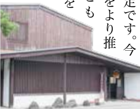
奥田酒造店(国登録文化財・協和地域境地区)