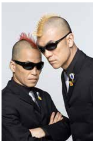
海外でも人気のサイレントコ メディー・デュオ「が〜まるち よば」が大仙市に初見参

ホール ◆プレイガイド／CAOS広 場(トピコ)、大曲市民会 館、ローソンチケット(L コード:21646)、チケ ットぴあ(Pコード:487 1524)、セブンチケッ ト、イープラス