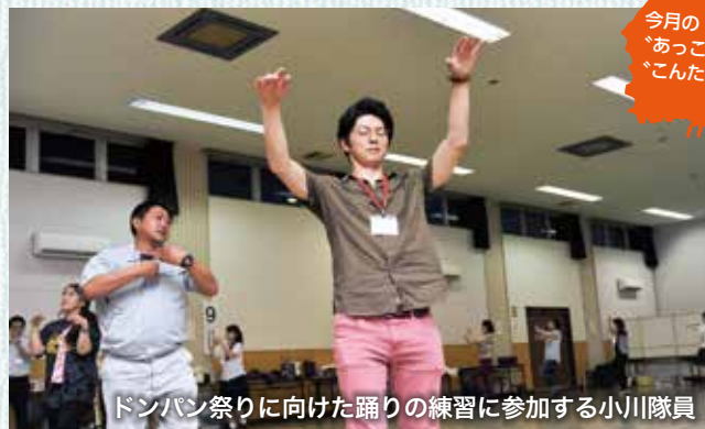
今月のあっこ、こんたごど。