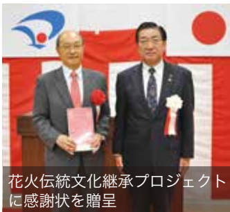
花火伝統文化継承プロジェクトに感謝状を贈呈