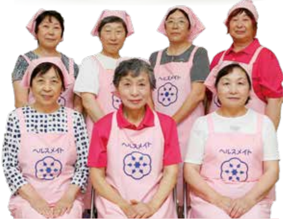
今月のレシピ当番は中仙支部です