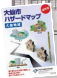
改訂した大仙市ハザードマップ