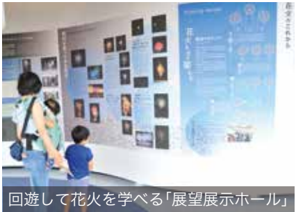
回遊して花火を学べる「展望展示ホール」