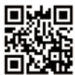
↑登録用2次元コード

登録していただけます 「防災ネットだいせん」は、「防災・災害情報」「避難情報」などを、市民の皆さんの携帯電話やスマートフォンに一斉配信する市独自のメールシステムです。 システムは今年2月のバージョンアップで、Jアラート(全国瞬時警報システム)からの情報をより迅速に配信できるようにになりました。いざという時に備え、ぜひ登録してください。