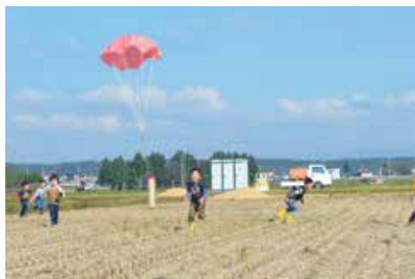
年代別に残月花火の争奪戦を繰り広げる大会

め、各会所路上や慶事のあった家の軒先で花火を打ち上げていました。轟音の迫力は、祭典の名物で、花火の音の大きさを神輿がどのあたりを通過しているか知ることができました。祭典の昼花火として打ち上げられた残月花火には、各家々の子ども達の誕生や還暦などの祝い事などを書いた紙を付け、地域に周知する役割が