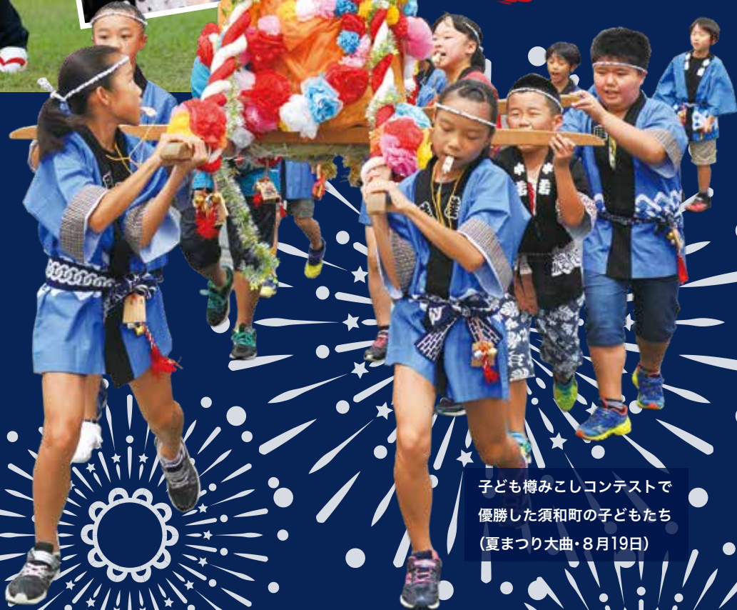
子ども樽みこしコンテストで 優勝した須和町の子どもたち (夏まつり大曲・8月19日)