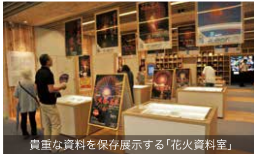
貴重な資料を保存展示する「花火資料室」