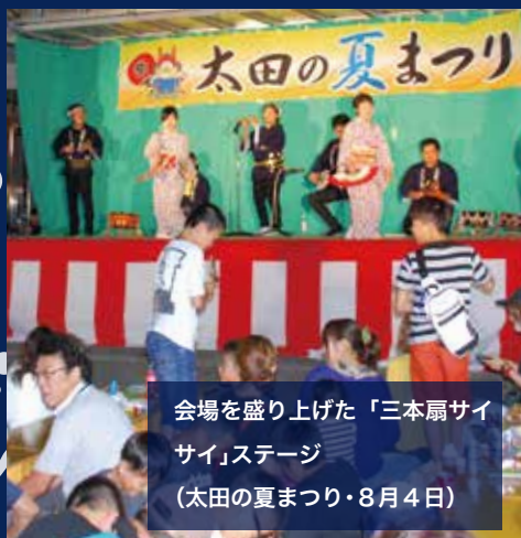
会場を盛り上げた「三本扇サイ サイ」ステージ (太田の夏まつり・8月4日)