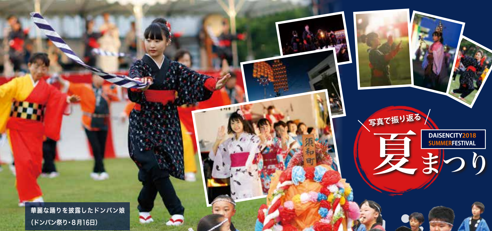
華麗な踊りを披露したドンパン娘 (ドンパン祭り・8月16日)