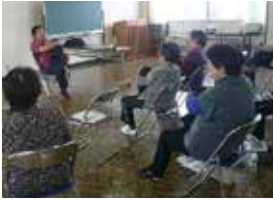
昨年度開催した健康教室「腰痛膝痛の緩和について」(藤木公民館)