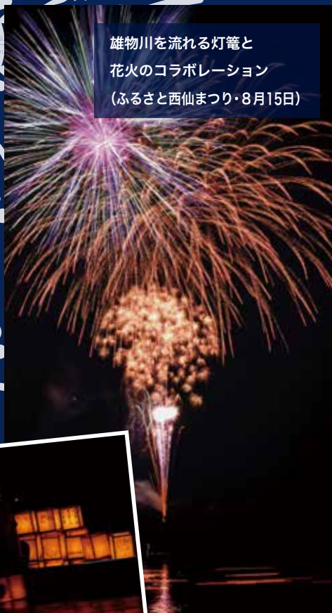
雄物川を流れる灯籠と 花火のコラボレーション (ふるさと西仙まつり・8月15日)