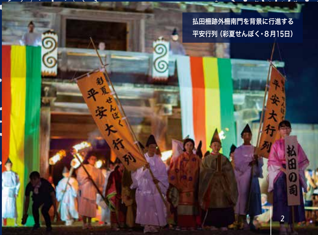
松田柵跡外柵南門を背景に行進する 平安行列 (彩夏せんぼく・8月15日)