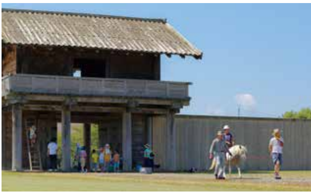
弘田柵跡外柵南門を背に、乗馬を体験する参加者