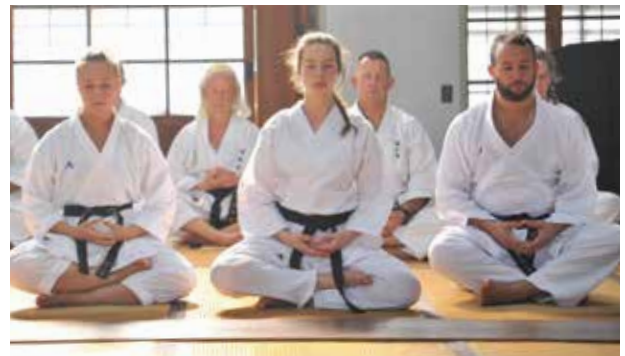
座禅を通して精神修養に励んだ海外セミナー座禅会

同会では毎年7月下旬に同会所属の外国人空手愛好家を対象にした技術講習会を約30年前から大曲武道館（新築に伴い現在解体工事中）や大曲体育館で実施しており、今年は約130人が参加。座禅会は、同会がセミナー参加者に日本の文化に触れながら精神力を鍛えてもらおうと企画したものです。参加した外国人は静寂に包まれた会場の中で禅の世界に浸っていました。