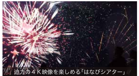
迫力の4K映像を楽しめる「はなびシアター」