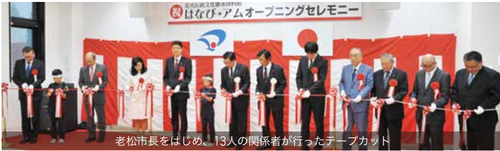
老松市長をはじめ、13人の関係者が行ったテープカット