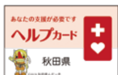
←ヘルプマーク(左)とヘルプカード