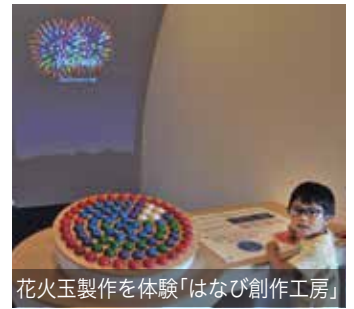
花火玉製作を体験「はなび創作工房」