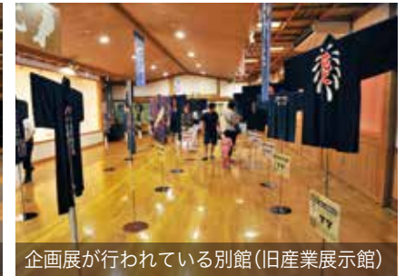
企画展が行われている別館(旧産業展示館)