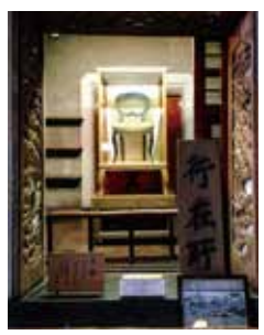
明治天皇ご使用の椅子