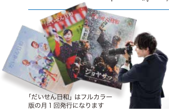
「だいせん日和」はフルカラー版の月1回発行になります

今年度から月1回発行に 「だいせん日和」 平成17年4月の創刊以来、毎月2回発行していた市広報紙「だいせん日和」は、今月号から毎月1回発行（毎月1日発行）になります。これに伴い、これまで毎月16日に発行していた「おしらせ版」は廃止します。 「だいせん日和」は今後も行政情報を中心に、生活に密着した話題を市民の皆さんにお届けしていきます。引き続き紙面づくりへのご理解とご協力をお願いします。 【問い合わせ】 広報広聴課内線274