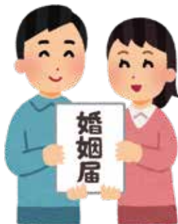
ゴールデンウィーク前の事前審査にご協力ください

ゴールデンウィーク中に婚姻届を提出予定の方へ 連休前の事前審査にご協力ください 5月1日の「即位の礼」に伴う祝賀ムードの高まりから、今年のゴールデンウィークは例年と比較して婚姻届を提出される方が多いと見込まれています。 ゴールデンウィーク期間中に婚姻届などの戸籍に関する届け出をする予定の方は、スムーズに届け出できるように、市民課での事前審査にご協力ください。 市民課内線151