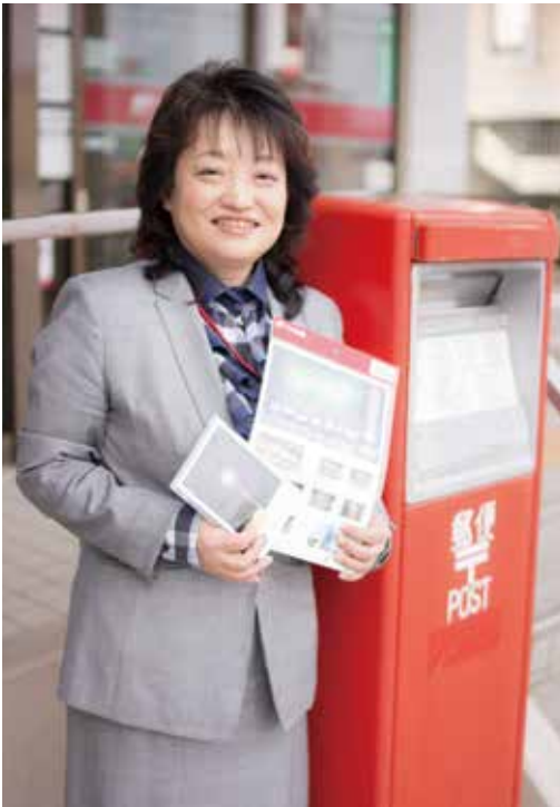
日本郵便 大曲郵便局