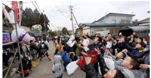
町内ごとに行われた餅まき

同園は、昭和41年に旧土川児童館で保育を開始。園児数の増加などに対応するため、昭和60年に園舎を新築しました。平成11年には心像保育園と統合し、園児の定員は80人になりましたが、少子化などの影響で園児数は年々減少。平成30年度で閉園を迎えることになりました。式では園児や同園職員によるお別れの歌が園内に響きわたりました。