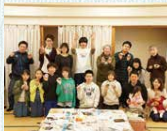
[写真左] warockづくり体験に集まった参加者の皆さん [写真右] 出来上がった絵入りの石を写真撮影