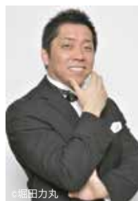
江口 玲 (ピアニスト)

◆ 申し込み方法 ◆ ※未就学児の入場はご遠慮ください。 「往復官製はがき」で左例のとおり申し込み ※応募者多数の場合は抽選。当選者には入場整理券（1枚で2人まで入場可）を、落選者には落選通知を5月28日（火）ごろ発送 ◆ 申込先 ◆ 〒014-0063 大仙市大曲日の出町2-6-50