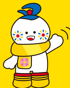
大仙市マスコットキャラクター まるびちゃん