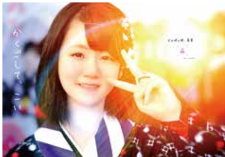
あなたも「ドンパン娘」の一員に

◆応募期限／6月7日（金） ◆採用特典／オリジナルQ.U.Oカード5千円分プレゼント ◆活動内容／ドンパン祭り