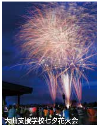
大曲支援学校七夕花火会