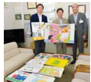
大曲ロータリークラブ -大型絵本・紙芝居-

寄付は市の防災教育に役立ててほしいと行われたものです。市では防災教育として、東日本大震災の被災地との交流や学校での避難所開設訓練などを毎年実施しています。