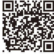
仙北地域振興局からの お知らせはこちらから