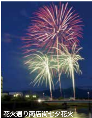
花火通り商店街七夕花火

7月12日に大曲支援学校で行われた七夕花火会は今回で28回目。踊りやじゃんけんゲームでの交流などのほか、夜空を彩る約300発の花火を楽しみながら、同校の生徒と来場した皆さんが交流を深めました。