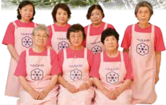
今月のレシピ当番は太田支部です