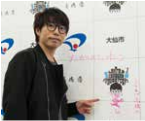
9月14・15日に「秋田キャラバンミュージックフェス2019」を開催する高橋優さん