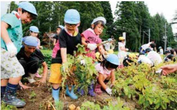
ジャガイモを収穫する園児たち

同体験は、農作業を通じて同施設に親しんでもらおうと、市が園児たちを招いて毎年実施しているもの。今回は西仙北中学校の生徒1人がボランティアとして園児たちの収穫をサポート。雨のため収穫は途中で終わってしまいましたが、参加した園児たちは、施設の職員や研修生のサポートの下、さまざまな大きさのジャガイモを収穫しました。