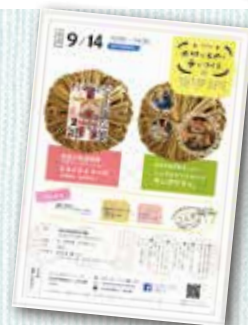
[写真左] 南外地域荒沢地区の鐘馮様の作り替え作業 [写真右] 9月14日に開催するワークショップのチラシ

村 を守る不思議な神様、という名で秋田県内の人形道祖神(鐘馮様やオニヨ様)を全国に向け発信している「秋田人形道祖神プロジェクト」。発行している本では、独特なイラストとユーモラスな解説で、秋田県内の人形道祖神を紹介しています。現在、市内の約4カ所の人形道祖神が本で紹介されています。東京都内の本屋さんでもトークショーや、イラストの原画展を開催し、秋田県の不思議な魅力を広く発信しています。