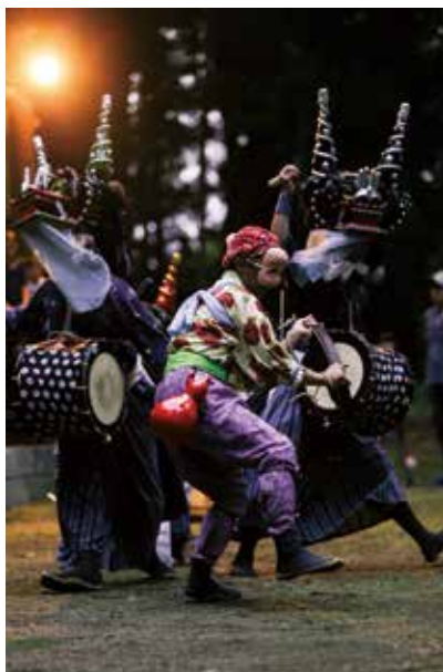
別雷神社で行われたささら舞い

8月19日には東長野地区の別雷神社で、地域住民が見守る中、躍動感あふれるささら舞いが奉納されました。