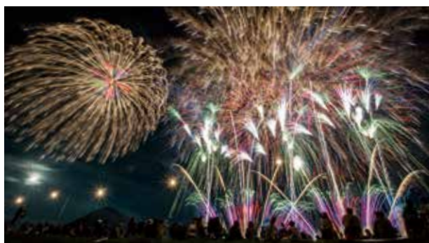
月明かりに照らされる嶽山を背景に打ち上がった花火

八幡神社祭典の奉納花火として毎年行われているこの大会は、今回で40回目の開催。地元の商工業者や建設業者などが43プログラムを提供し、神宮寺岳(通称・嶽山)を背景に約7,000発の花火が打ち上げられました。地元花火業者の120周年記念を祝うメモリアル花火120連発や新しい時代の船出をイメージしたフィナーレ花火など、迫力あるプログラムを披露。会場を訪れた観客は、仲秋の夜空を彩る色鮮やかな光の軌跡と神宮寺岳に響き渡る花火の音を楽しみました。