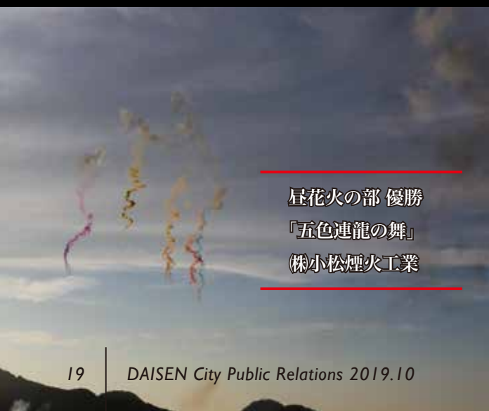
昼花火の部 優勝 「五色連龍の舞」 (株)小松煙火工業

大会の成績は、「大曲の花火」オフィシャルサイト ( https://www.oomagari-hanabi.com/ ) に掲載されています。YouTubeの大曲の花火実行委員会のチャンネルに今大会のダイジェスト動画がアップされています。ぜひご覧ください。