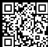
オフィシャルサイト

大会の成績は、「大曲の花火」オフィシャルサイト ( https://www.oomagari-hanabi.com/ ) に掲載されています。YouTubeの大曲の花火実行委員会のチャンネルに今大会のダイジェスト動画がアップされています。ぜひご覧ください。