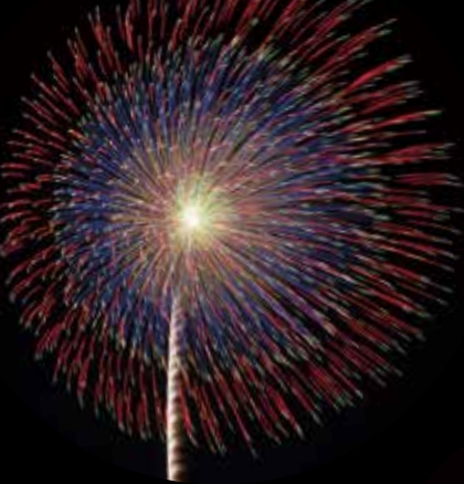
10号芯入割物の部 優勝 野村花火工業(株) 「昇曲付五重芯変化菊」