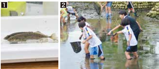
1 保全池に生息するイバラトミヨ 2 生き物を捕まえる清水小学校の児童たち

参加した児童たちは、水を抜いた保全池のぬかるみに足をとられながら、イバラトミヨやドジョウなどの魚やアメリカザリガニを捕まえ、保全池に生息する生き物を観察していました。