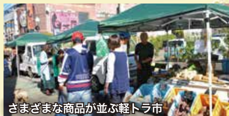
さまざまな商品が並ぶ軽トラ市