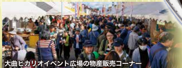
大曲ヒカリオイベント広場の物産販売コーナー