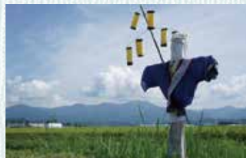
[写真左] 田んぼにたたずむかかし [写真右] 講演会のチラシ