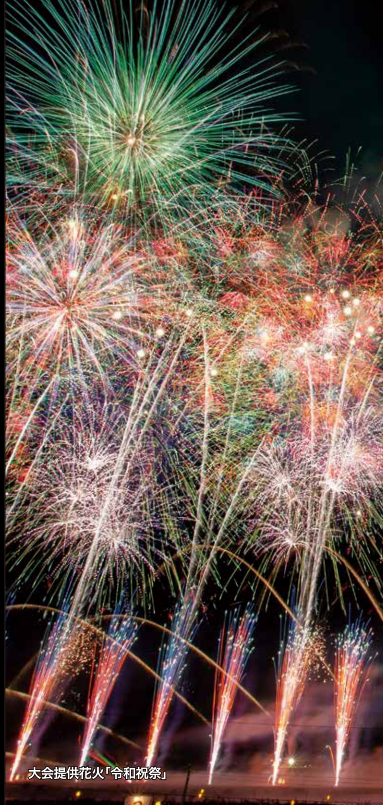
大会提供花火「令和祝祭」