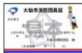
↑ 消防団員証 見本