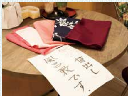
無料で貸し出されている風呂敷

大仙で暮らし始めて半年が経ちました。多くのイベントやお祭りが中止になっていますが、少しずつ地域の方と関わる機会が増えています。どこに行っても丁寧に対応していただき、大仙の方々の温かさを感じます。