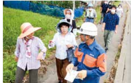
消防団員の誘導で避難する地域住民

地域住民は、ため池管理者や自治会長、消防団の呼びかけのもと避難。その後の安否確認訓練も実施しました。