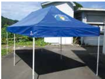
太田地域自治組織連絡協議会で購入したテーブル・イス(写真上)と協和地域境町内会で購入したワンタッチ式テント