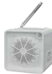
防災ラジオは自動的に電源が入り、起動信号音の後に試験放送が流れます。