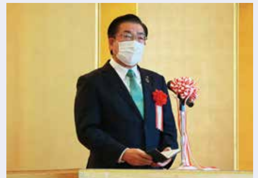
中仙小学校創立50周年記念式典であいさつをする老松市長(9月5日)