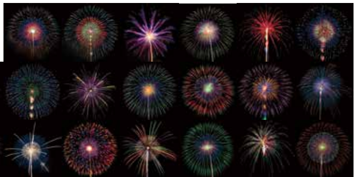
「第94回全国花火競技大会」に出品予定だった28花火業者による10号玉のメッセージ花火