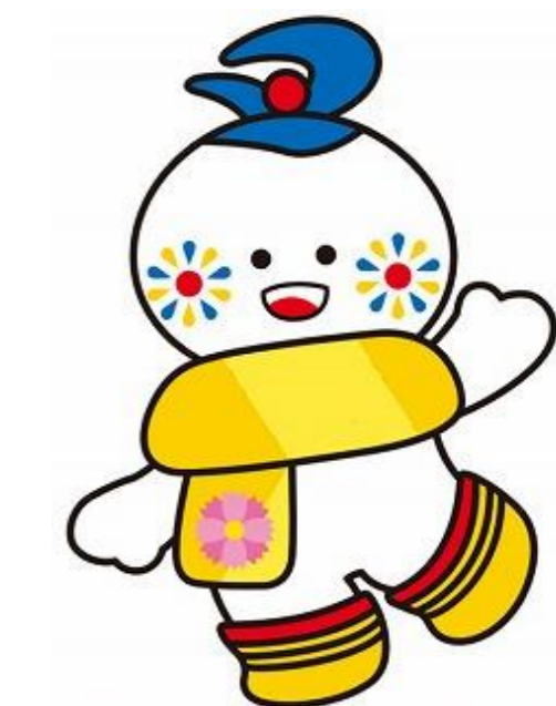
大仙市マスコットキャラクター まるびちゃん