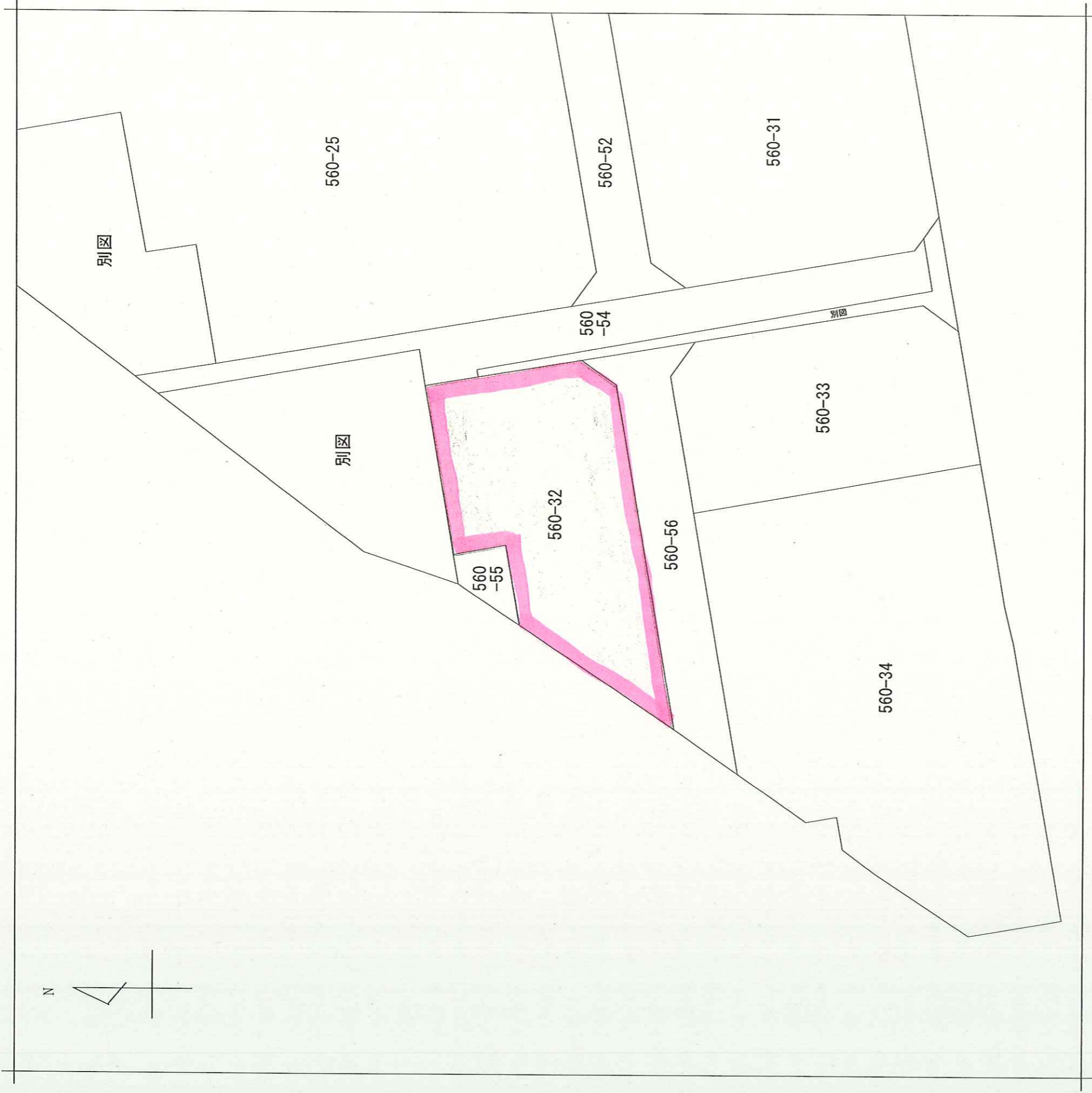
地番区域見出 地番区域見出