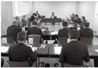
産業建設常任委員会の様子

A 本会議で付託された事件（議案や請願、陳情）を専門的かつ詳細に審査します。委員会で審査後、付託事件の賛成・反対を決め、本会議で委員長が報告します。委員会も本会議同様に傍聴することができます。