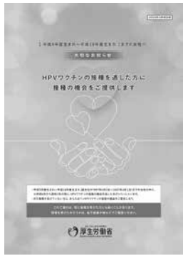
キャッチアップ接種リーフレット (厚生労働省ホームページより引用)