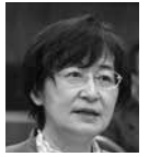
利恵 挽野 (公明党)