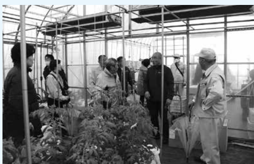
「東部新規就農者研修施設」の視察