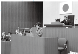
本会議場での委員長報告の様子

A 委員長報告とは、委員会で審査を終えた事件が本会議の議題となったとき、委員長から審査の経過と結果（賛成・反対）について口頭で報告することをいいます。本会議では通常、委員長の報告は本会議最終日に行われ、これに対して質疑、討論、表決が行われた後、最終的な決定（可決・否決など）がなされます。