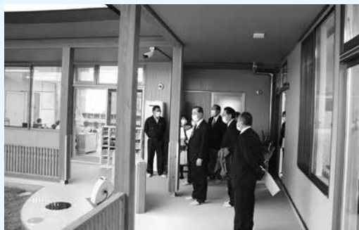
「大曲北保育園」の視察