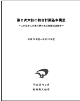
市ホームページ掲載

A 令和元年度に県の事業として県内5市町を対象に、モデル地区を設定した上で、人口の分析やワークショップが実施されているが、身近な生活圏単位で現状を知るとともに、増やすべき人口が見える化されることに