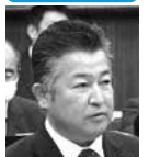
秩父 博樹 (公明党)