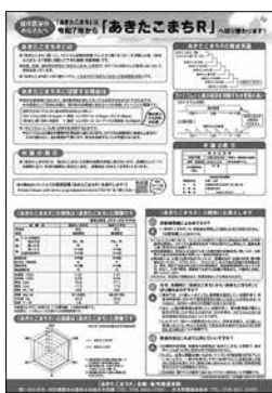
生産者向けリーフレット

しかし、県では、科学的見地や学識経験者の意見として、マンガンはさまざまな食品に含まれるミネラルであり、米の含有率が下がったとしても、栄養を摂取する上で問題はないとしている。市の学校給食においては、これまでどおり地元産のお米として提供できると考えている。