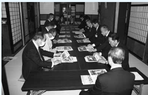
日本郷家住宅で説明を受ける