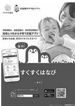
母子モのチラシ (市ホームページ掲載)