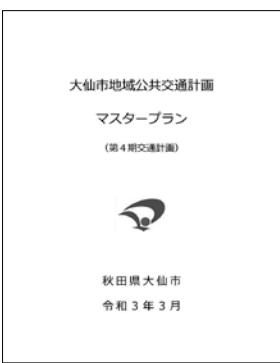
市ホームページ掲載