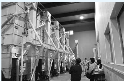
「農事組合法人 新興エコファーム」の視察