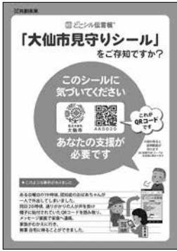
どこシール伝言板のチラシ (市ホームページ掲載)

A 「どこシール伝言板」の名称で、令和3年度から事業を開始しており、市のホームページやFMはなび、各医療機関、市内循環バス等で周知を行っている。QRコードのシールを貼り付けたものを身に付けている方を発見した市民が、どのような対応をしたらよいのかという情報が十分に伝わっていない状況もあったことから、今年度、市民向けに発見時の対応に関するチラシを作成したところである。