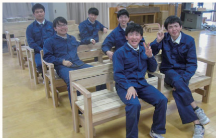
▲地場産材を利用し、大曲工業高校の生徒が製作した木製ベンチ。木製備品の導入を後押しします。