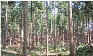
▲利用期を迎えている山林の好循環利用を促進する必要があります。