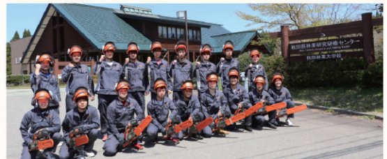
▲若き林業従事者の育成が求められています。