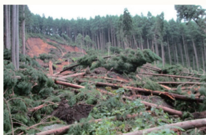
▲きめ細やかな林地、林道の緊急補修を行い山地災害の未然防止に努めます。