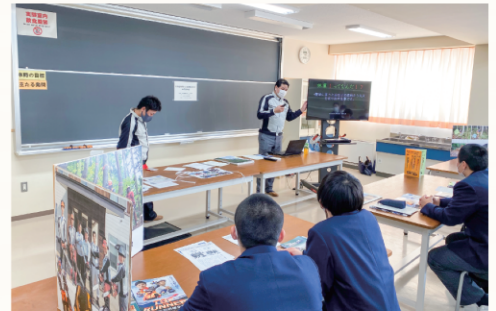
▲大曲農業高校主催「職業としての農業」フォーラムで出前説明する経営体

新規事業 大仙市フォレストパートナーシップ事業 林業の担い手育成やスマート林業の導入など、業界共通の課題に協同で取り組む