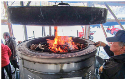
▲森林資源を花火産業構想等の木材需要のある施策での活用を図ります。