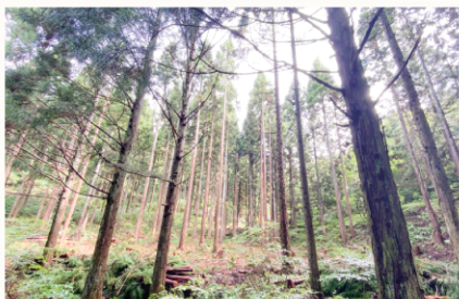
▲市内の人工林は利用期を迎え、継続的な林道整備をすることで搬出利用を推進します。