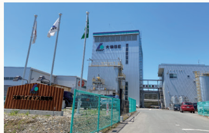
▲協和地域のバイオマス発電。未利用材を活用する木質バイオマスを推進します。