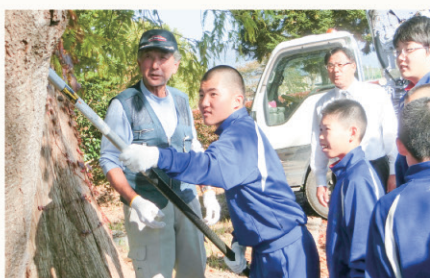
▲普及啓発の担い手となる森林ボランティアの支援を推進します。