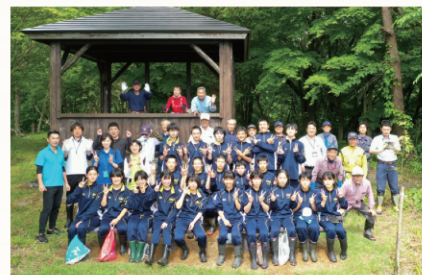
▲課外学習等を通じて森林整備の必要性を普及啓発する活動を推進します。