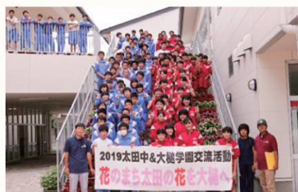
▲未来へつなぐ森林の必要性を交流体験などを通じて子供たちに普及啓発をします。