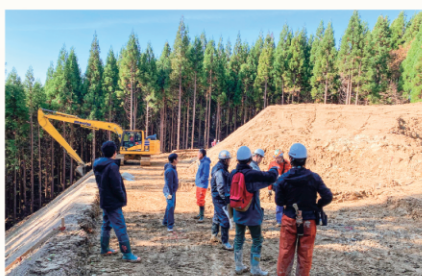
▲関係機関と連携し、効果的な林道整備を推進します。