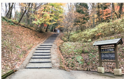
▲ふれあいの森等の既存ストックを活用した普及啓発を推進し、交流人口拡大を図ります。