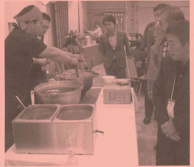
～B級グルメ・カレー旨麺に舌鼓を打つ～