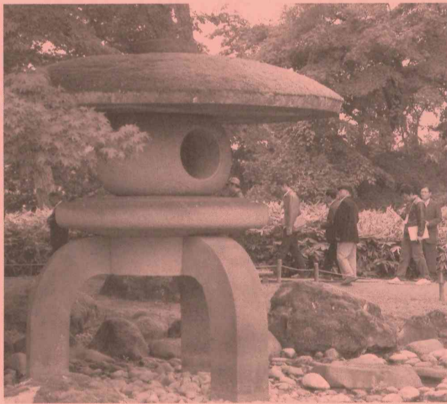
～国名勝・旧池田氏庭園を見学～