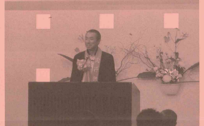
～特別ゲストの俳優・柳葉敏郎さん～