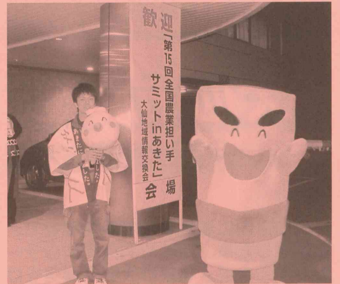
～つつどんとたまちゃんがお出迎え☆～

全国農業担い手サミットは各都道府県持ち回りで開催され、第16回大会は石川県で開催されることが決定しています。