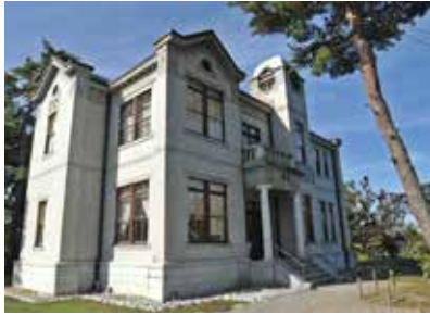
特別公開時限定で2階を含めた全館を見学できる「旧池田家住宅洋館」