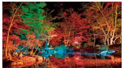
色付いた木々が鮮やかにライトアップされ、幻想的な光景に包まれる庭園内

庭園（払田字真山1） ※入場無料 ◆注意事項／ ○一脚や三脚での写真撮影などは、東屋付近のスペースに限定します。 ○園内通路以外は立ち入り禁止です。 【問い合わせ】 仙北支所市民サービス課