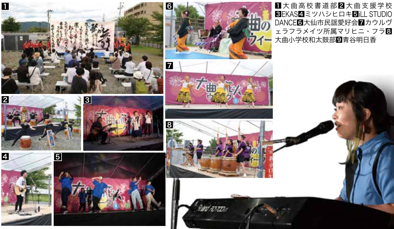
1 大曲高校書道部 2 大曲支援学校 3 EKAS 4 ミツハシヒロキ 5 iLL STUDIO DANCE 6 大仙市民謡愛好会 7 カウルヴェラフラメイツ所属マリヒニ・フラ 8 大曲小学校和太鼓部 9 青谷明日香