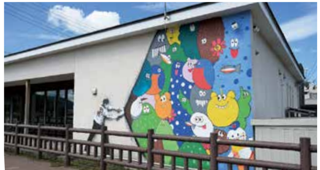
3年生が製作したウォールアート