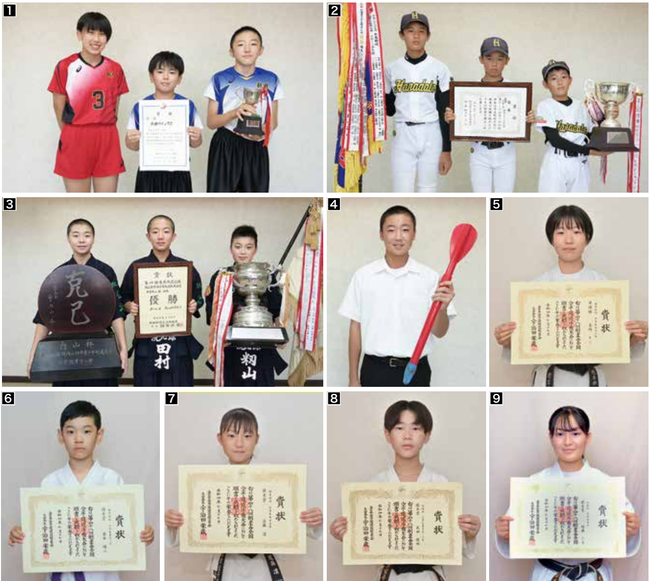
【第42回全日本バレーボール小学生大会秋田県大会】