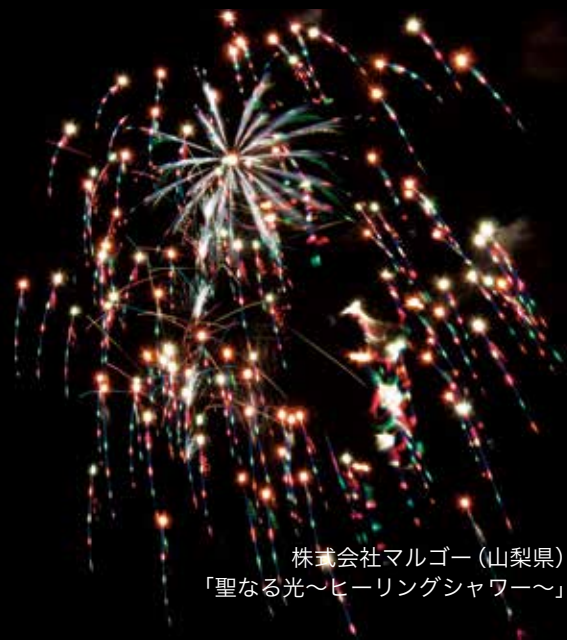
株式会社マルゴー(山梨県) 「聖なる光〜ヒーリングシャワー〜」