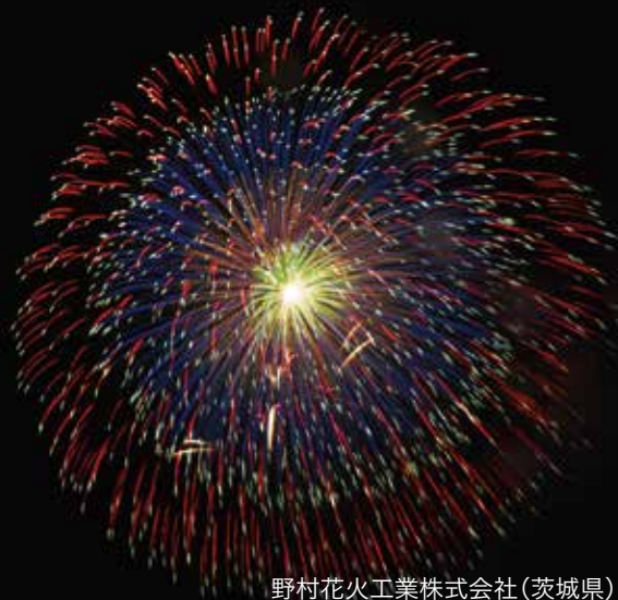
野村花火工業株式会社(茨城県) 「昇曲導付五重芯変化菊」