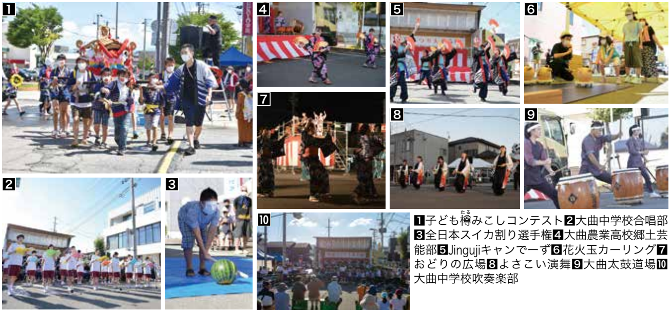
1 子ども樽みこしコンテスト 2 大曲中学校合唱部 3 全日本スイカ割り選手権 4 大曲農業高校郷土芸能部 5 Jinguji キャンデーず 6 花火玉カーリング 7 おどりの広場 8 よさこい演舞 9 大曲太鼓道場 10 大曲中学校吹奏楽部