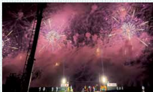
煙が舞台演出のようにも感じた大会提供花火

大 仙市の地域おこし協力隊に着任してから3年目になりますが、過去2年延期になっていたこともあり、今まで「大曲の花火」を見たことがありませんでした。そのため、今年の大会を楽しみにしていたのですが、天気はあいにくの雨。私の見ていた場所では、煙が流れず花火が見えにくい状況が続いていました。