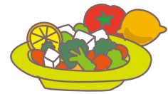
食を通じた健康づくり活動をするため、栄養に関する講義や調理実習も行います。