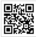
給付金の詳細や電子申請の方法はこちら