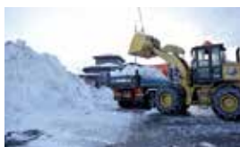
雪が降らなくても、深夜の出勤があっても、日中は道幅が狭くなった箇所や一時堆雪場の除排雪を行い、道路維持や安全確保のため作業に徹する(上) 同じ路線でも雪質や降雪量により環境が変わる。臨機応変かつ限られた時間の中で行われる除雪作業(右)