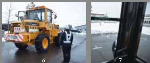
[4・5] 除雪車の後ろに立った場合。日中でも見えづらい [6・7] 右斜め後方は窓枠と重なり見えづらく、全く見えなくなる場合もある

今回、試乗した市の除雪ドーザ 全長7.54m、全幅・全高3.4m、車両重量は約11t 窓が大きく高さもあるが思った以上に周囲は見えにくく、また、作業中は周囲の音も聞こえづらい