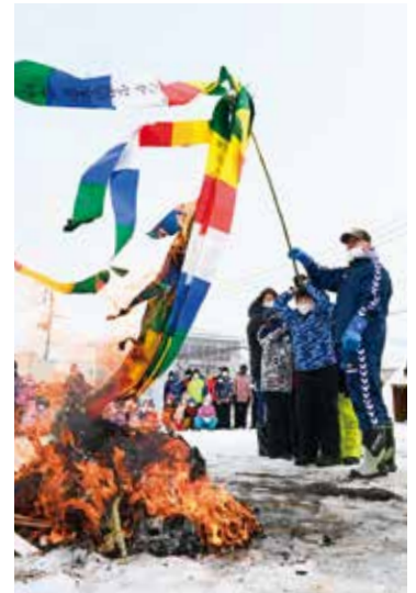
願いを込めた天筆を焼く東大曲小学校の児童たち

防火訓練後には「古四王堂（こしよど）火消しもち祭り」が行われ、今年のお米の豊作を願う雪中田植えや、焼いた天筆が空高く舞い上がれば願いが叶うとされている天筆焼きを行いました。