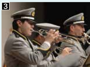
1 全国各地の消防団音楽隊で演奏されている「ハローファイヤーマン」を披露 2,3 練習の成果を発揮する隊員