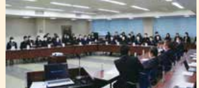
市議会議員と中学生の懇談会

中学生議会終了後は、市議会議員と中学生との懇談会を開催。市議会の仕組みや役割の説明を受けた中学生は、議員に対して市議会議員になったきっかけや、やりがいなどを質問。今後の大仙市について意見を交わしながら交流を深めました。