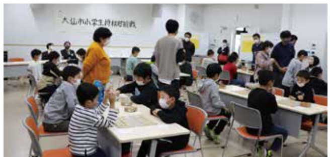
大仙市小学生将棋対抗戦