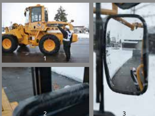
[1]作業中に除雪車を呼び止めようと近づいた場合 [2・3]運転席からよく見えるかと思いきや、運転席からは人の姿がほぼ見えない

オペレーター（運転席）からはどのように見えているのか。実際に除雪車両に乗り込み感じたのは、「死角」の多さ。