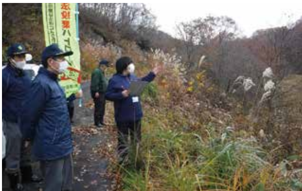
道路からの急斜面に不法投棄されている現場を確認する参加者

ごみの不法投棄は法律で禁止されています。違反した場合、5年以下の懲役もしくは1,000万円以下(行為者を監督する法人は3億円以下)の罰金に処されます。