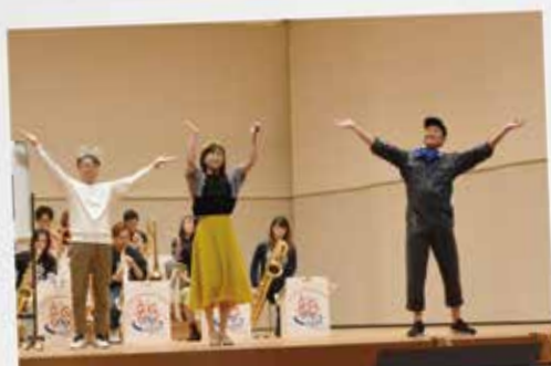
地域の方から誘ってもらい参加した「大仙市音楽祭」