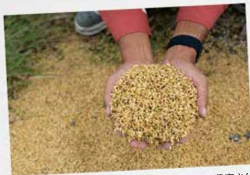
こぼれたもみを見せてくれる農家さん