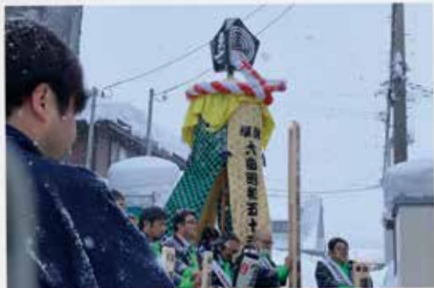
「大曲昭和五十五年会」による「大曲の梵天」