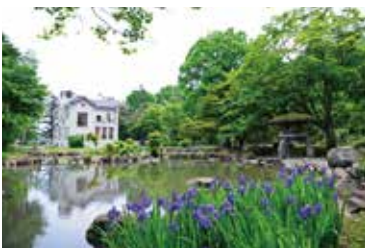
国指定名勝「旧池田氏庭園」