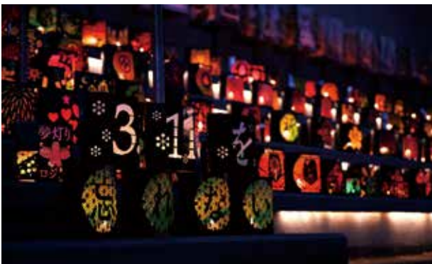
牛乳パックとカラースプレーで作られた「夢灯り」

午後5時から「夢灯りプロジェクト」で作成した灯籠約350個に明かりがともされ、幻想的な風景がヒカリオ広場を彩りました。