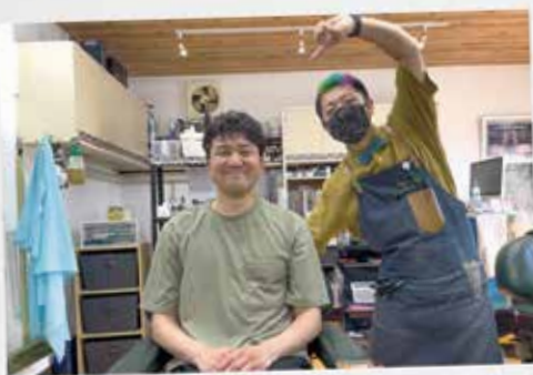
髪を切りながら取材に対応してくれた地域の床屋さん