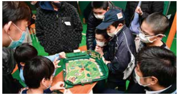
観客にも熱気が伝わるほどの盛り上がりを見せた交流会

決勝に進んだのは、小学校の友達で組んだ「おおぞらNiceHIT」と、親子で参加し、敗者復活から勝ち進んだ「チームイトウ」。最終回「おおぞらNiceHIT」が劇的なサヨナラ3ランホームランを放ち、記念すべき第1回大会での優勝を果たしました。