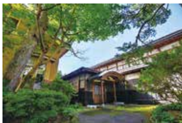
国登録有形文化財「旧本郷家住宅」

○夏季(大曲の花火)：8月25日(金)から27日(日)まで ○秋季：10月14日(土)から11月12日(日)まで ※詳細は、今後の広報紙などでお知らせします。