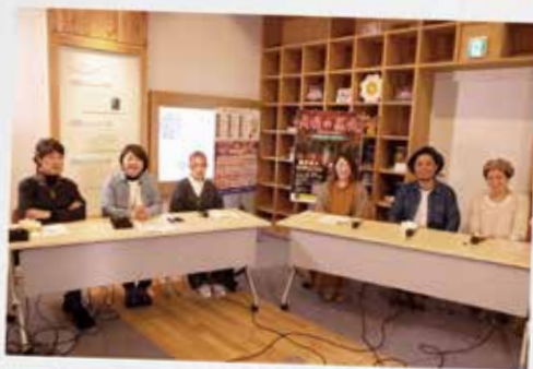
令和3年度オンライン移住体験ツアーで移住者の皆さんと