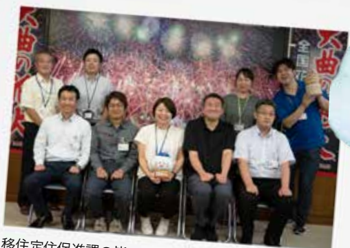
移住定住促進課の皆さんと

3月末に任期満了で退任した2人の地域おこし協力隊が、 3年間の活動で印象に残った思い出や これからのことを話してくれました。