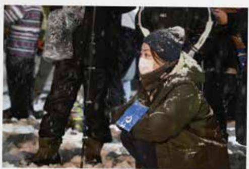
初めて見た「刈和野の大綱引き」