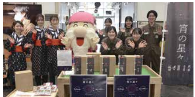
(写真上)「宵の星々」に関わった秋田大学の学生5人と、販売会を盛り上げようと駆けつけた「ドンパン娘」の皆さん (写真右) 完成発表会でお披露目された「宵の星々」

ートなどを実施しました。好調な売れ行きで用意した限定100セット（1セット720ml 5本入り・税込9,900円）が完売。酒米づくりから日本酒造り・販売・PRまで一貫して学生たちが関わる、国内の大学では珍しい事例を成功に導きました。